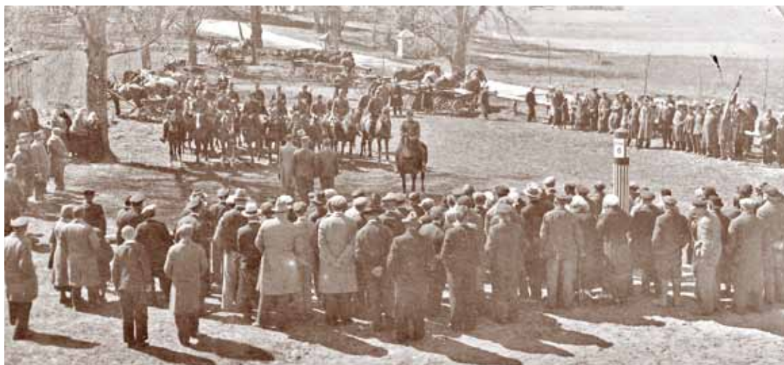
Ropažu nodaļas aizsargu parāde pie baznīcas 1935. gada 15. maija valsts atdzimšanas svētkos.