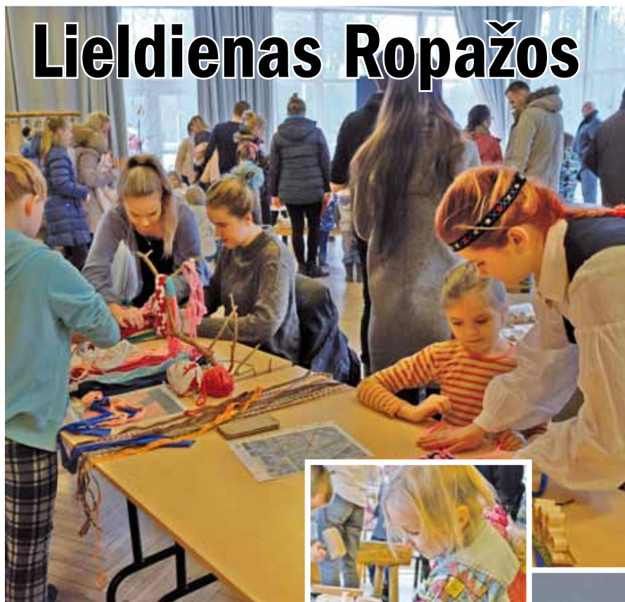
„Virbo” vainagu darināšana