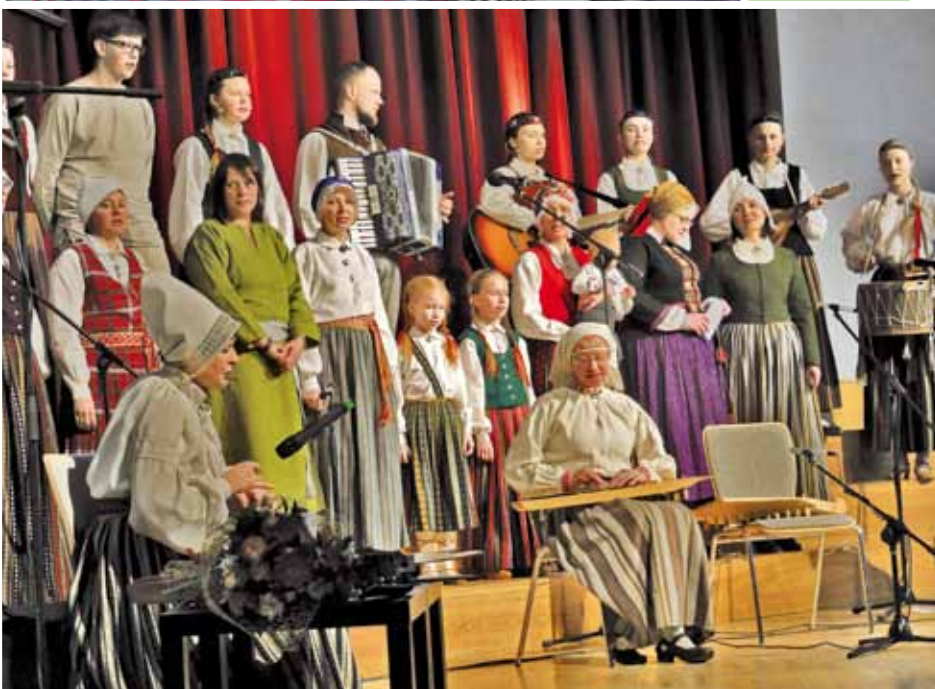
Folkloras kopas „Oglīte” CD prezentācijas pasākums