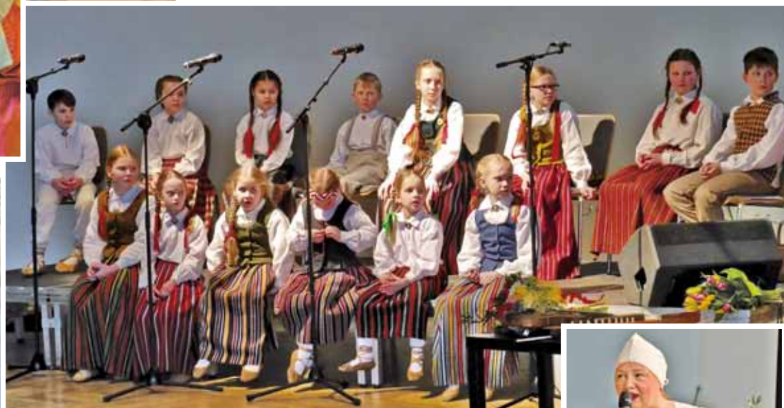
Folkloras kopas „Oglīte” jaunā CD prezentācija