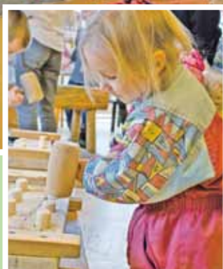
„Namdara darbnīca”, koka spēles