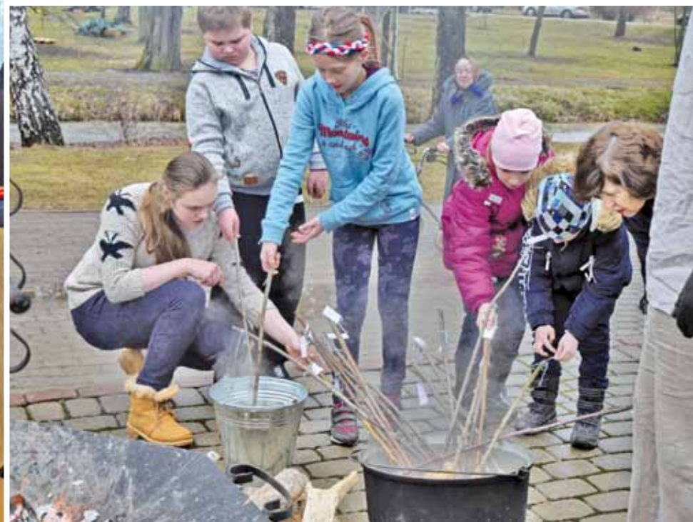
Tradicionālā olu krāsošana