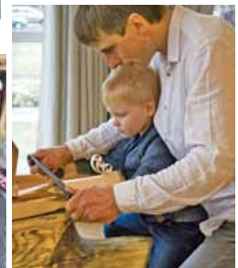
„Namdara darbnīca”, siles grebšana

Pārējos attēlus skatīt www.ropazi.lv fotogrāfijā.