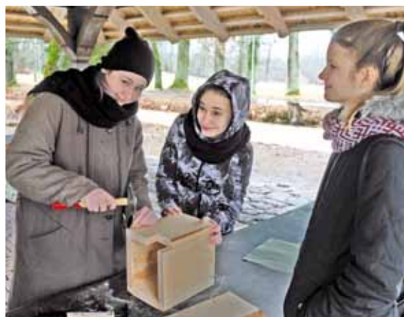
Putnu būrišu darināšana ar Ropažu vidusskolas ekoskolas skolēniem, skolotājiem un vecākiem