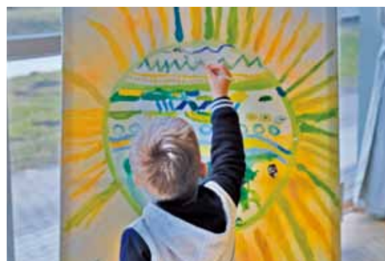
Lielformāta glezna ar Ropažu novada mākslas studiju