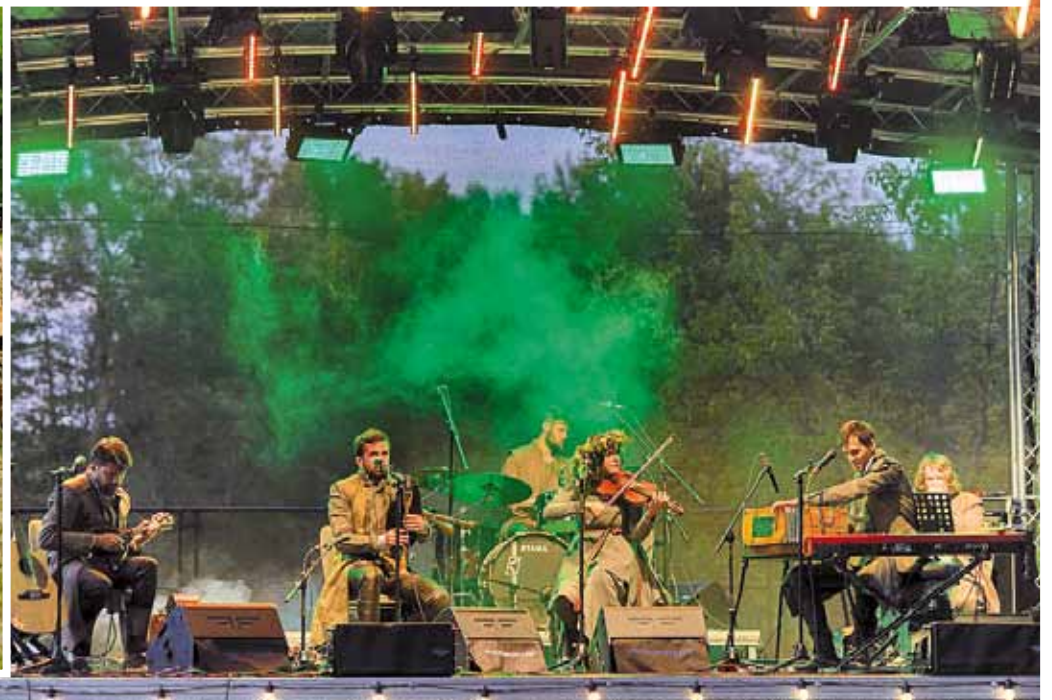
Koncerts ar apvienību „Raxtu Raxti”.