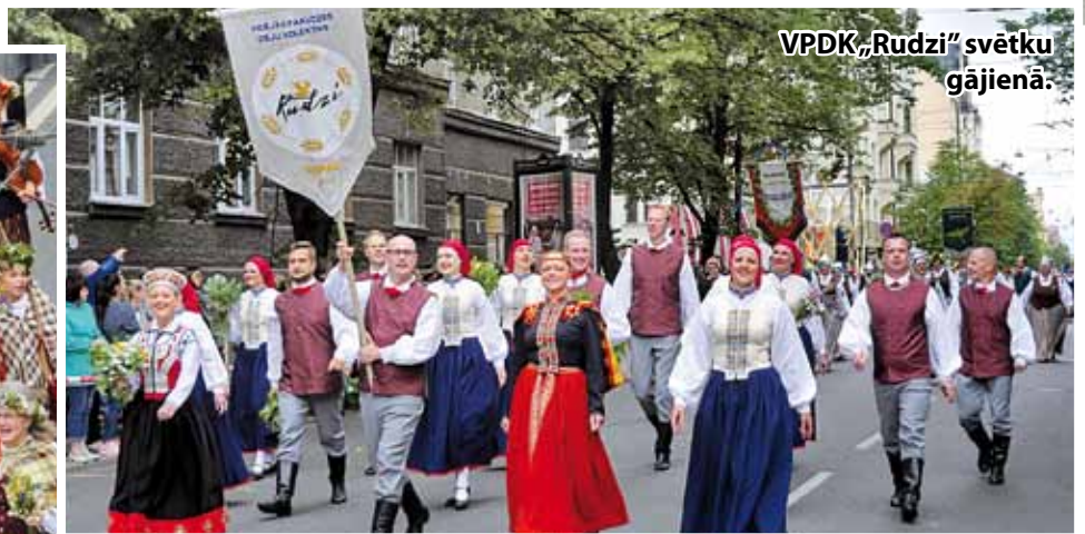
VPDK „Rudzi” svētku gājienā.