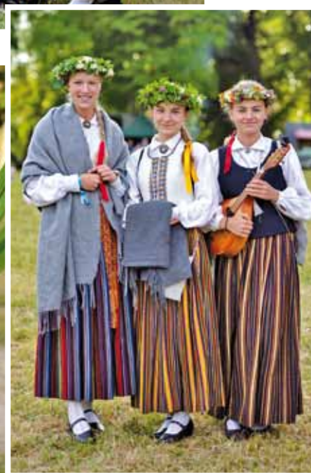
Folkloras kopas "Oglīte" meitenes.