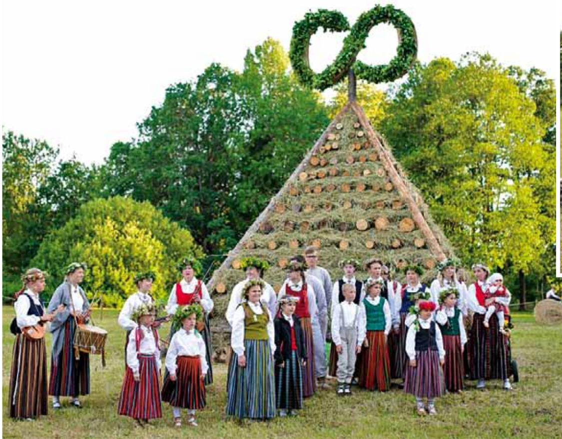
Folkloras kopa „Oglīte”.