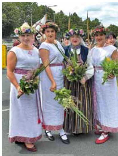
Kultūras centra komanda.