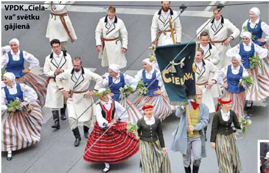
VPDK „Ciela-va” svētku gājienā