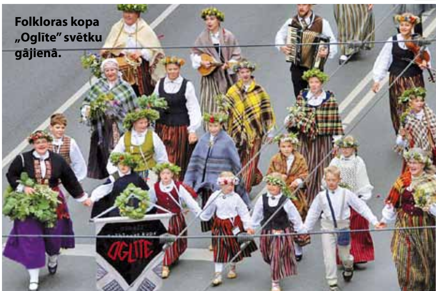
Folkloras kopa „Oglite” svētku gājienā.