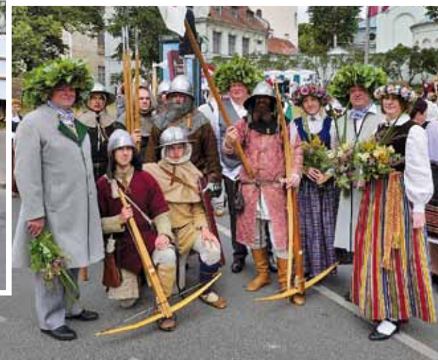
Vēstures rekonstrukcijas klubs „Rodenpoys” un novada domes vadība.