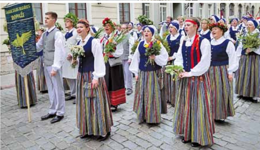
Koris „Ropaži” svētku gājienā.