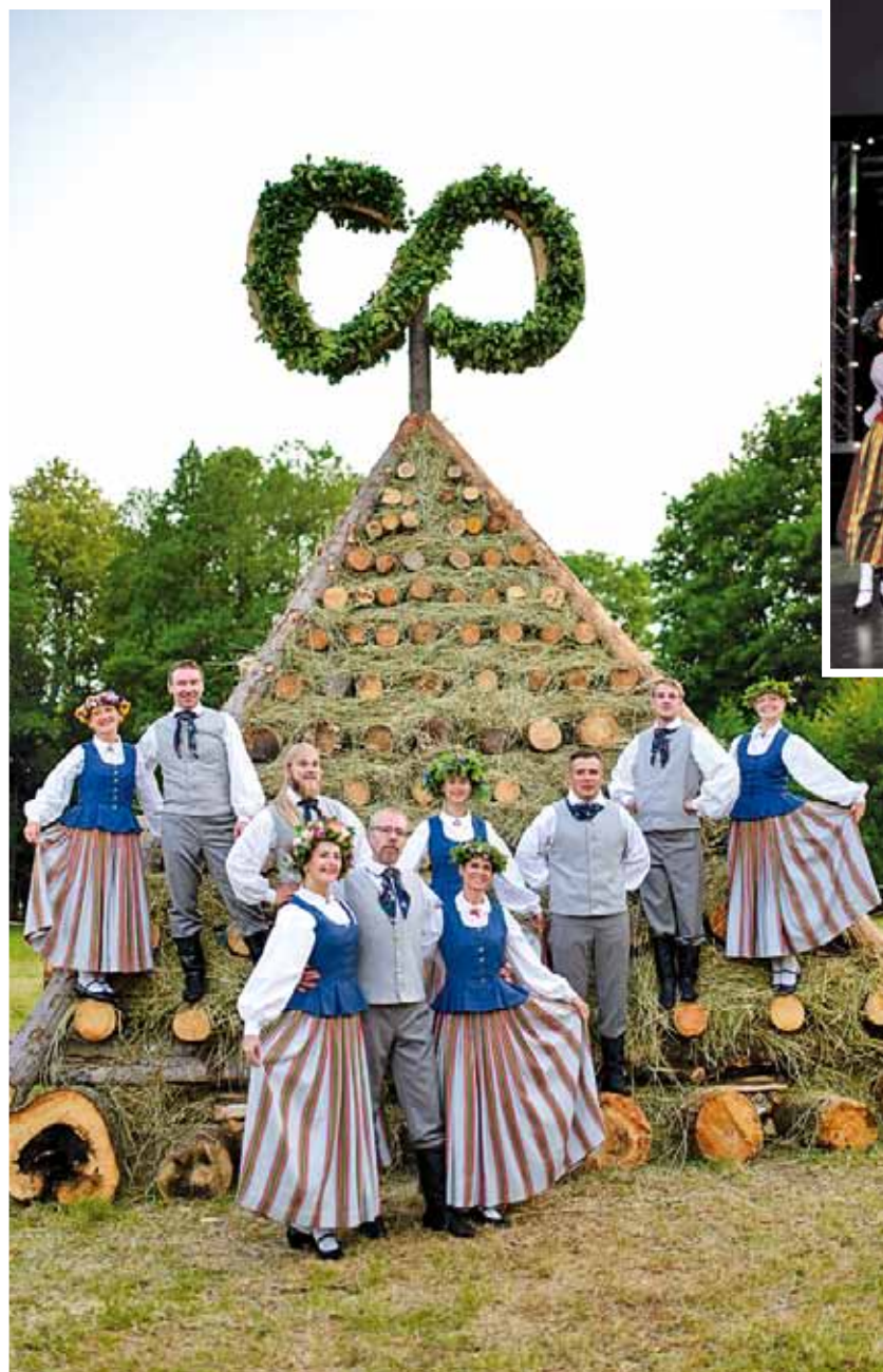
VPDK „Cielava” pie svētku ugunsкура ar Latvijas valsts simtgades simbolu (autors – Pēteris Ozoliņš).