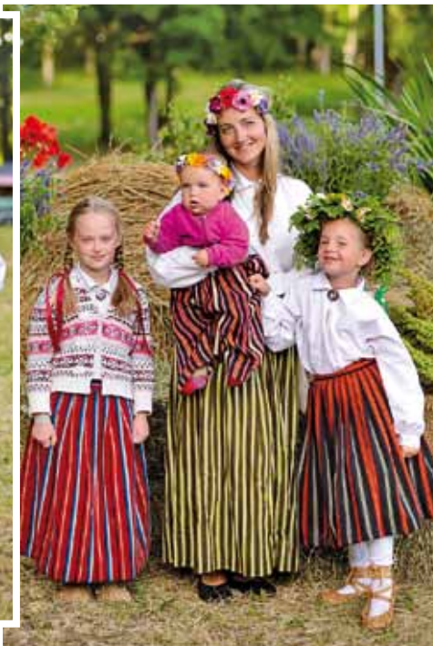
Ligo svētku 2018. viesi.