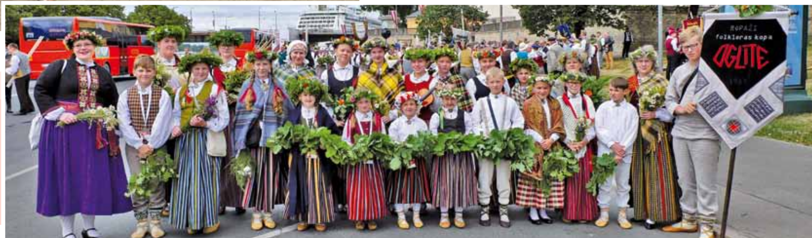
Folkloras kopa „Oglīte” svētku gājienā.