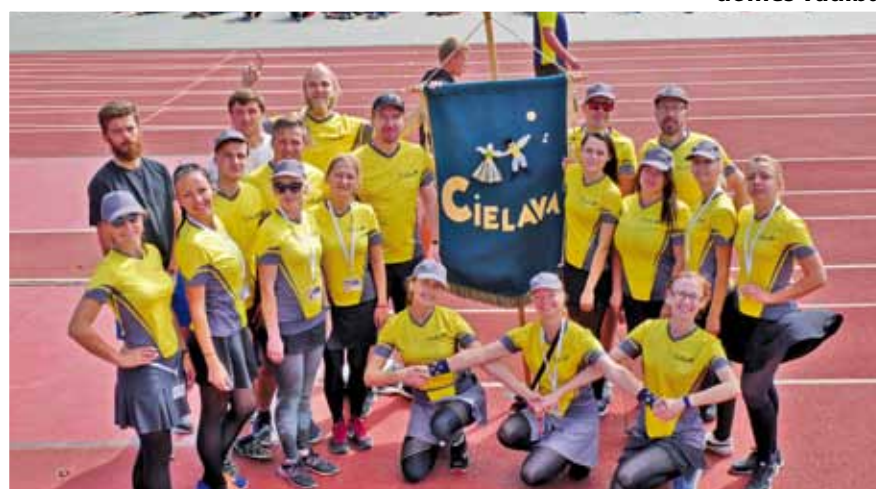
VPDK „Cielava” mēģinājumā Daugavas stadionā.