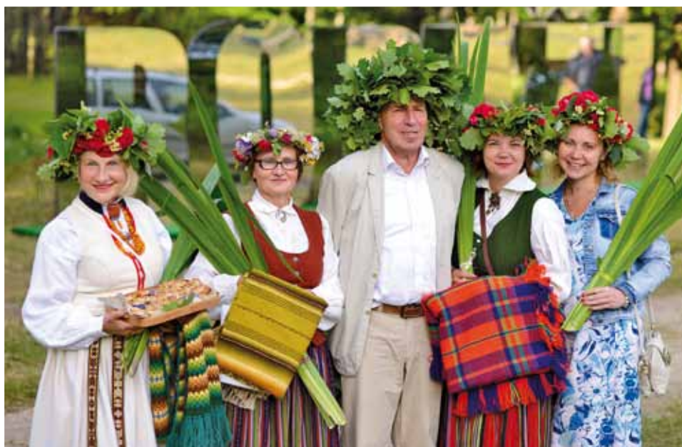
Ligo svētku 2018 viesi.