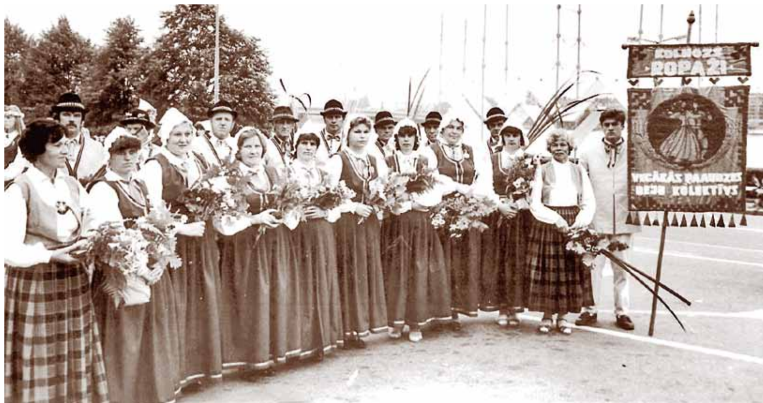
Esam gatavi startam Deju svētkos 1990. gadā!