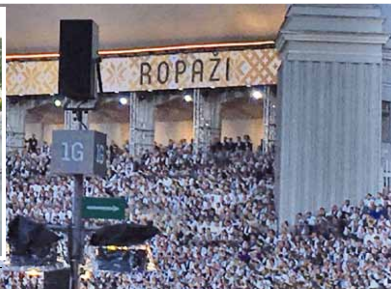
Novada vārds izskan lielajā Mežaparka estrādē.