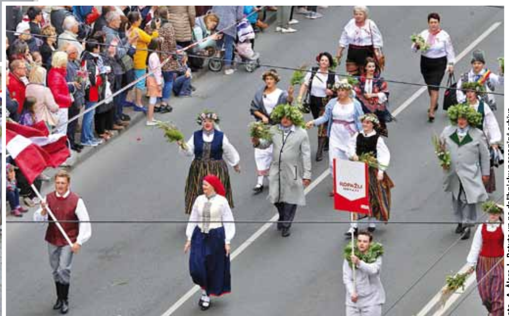
Ropažu novada domes, Kultūras centra un Moldovas delegācijas pārstāvji svētku gājienā.