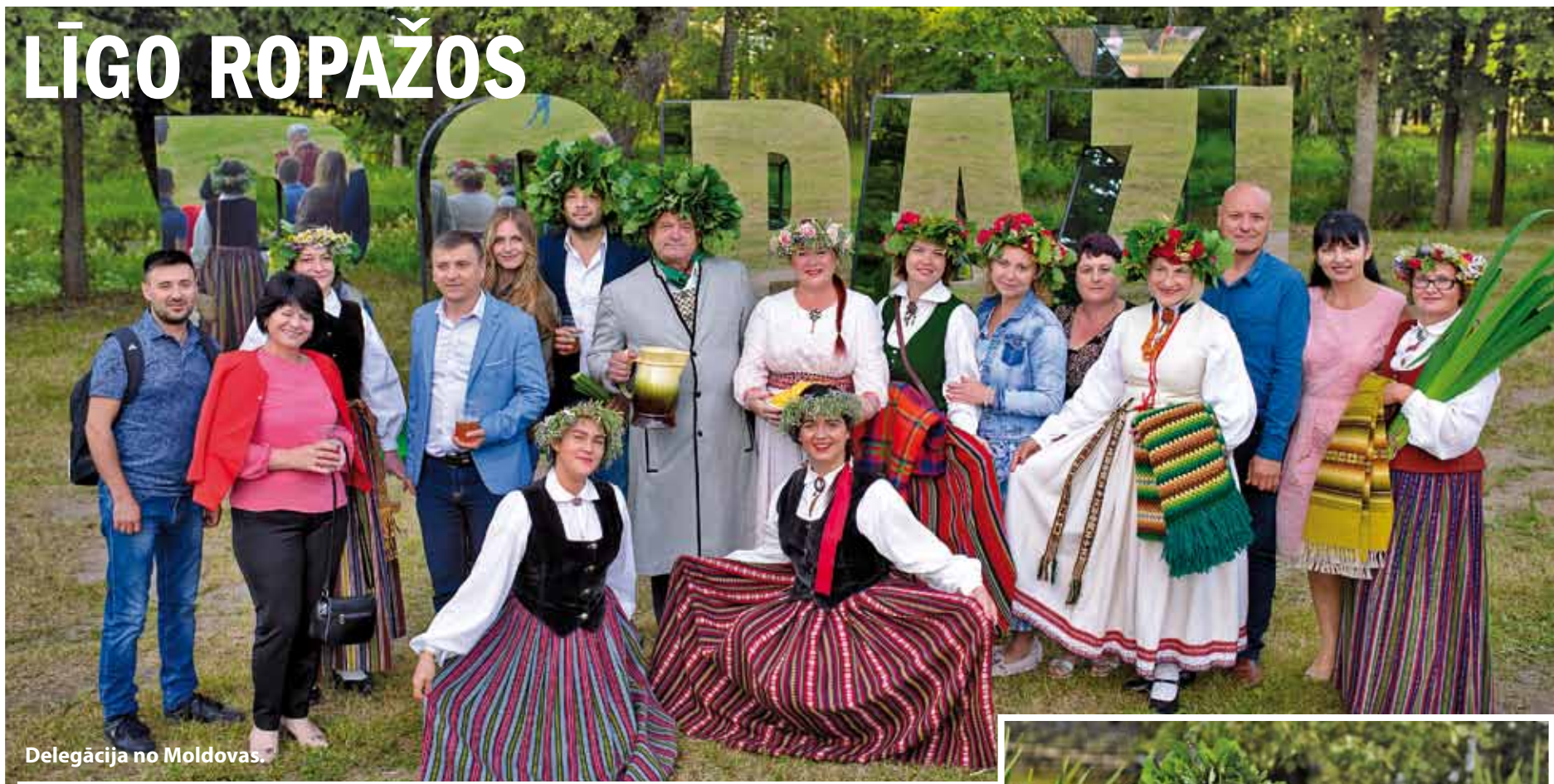
Delegācija no Moldovas.