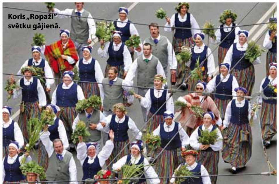
Koris „Ropaži” svētku gājienā.