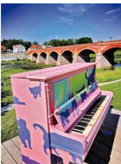
Biruta Banika, Pensionāru padomes Kultūras daļa