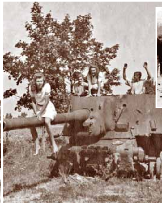
Sašautais Sarkanās armijas pašgājēja lielgabals „MGV-122” pie Jaunmuižniekiem 1947. gada Jānos.