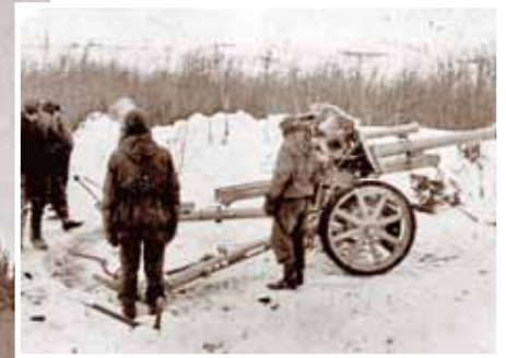
15. artilērijas pulka I divizionas pozīcijās pie Novosokolovņikiem 1944. gada janvārī.