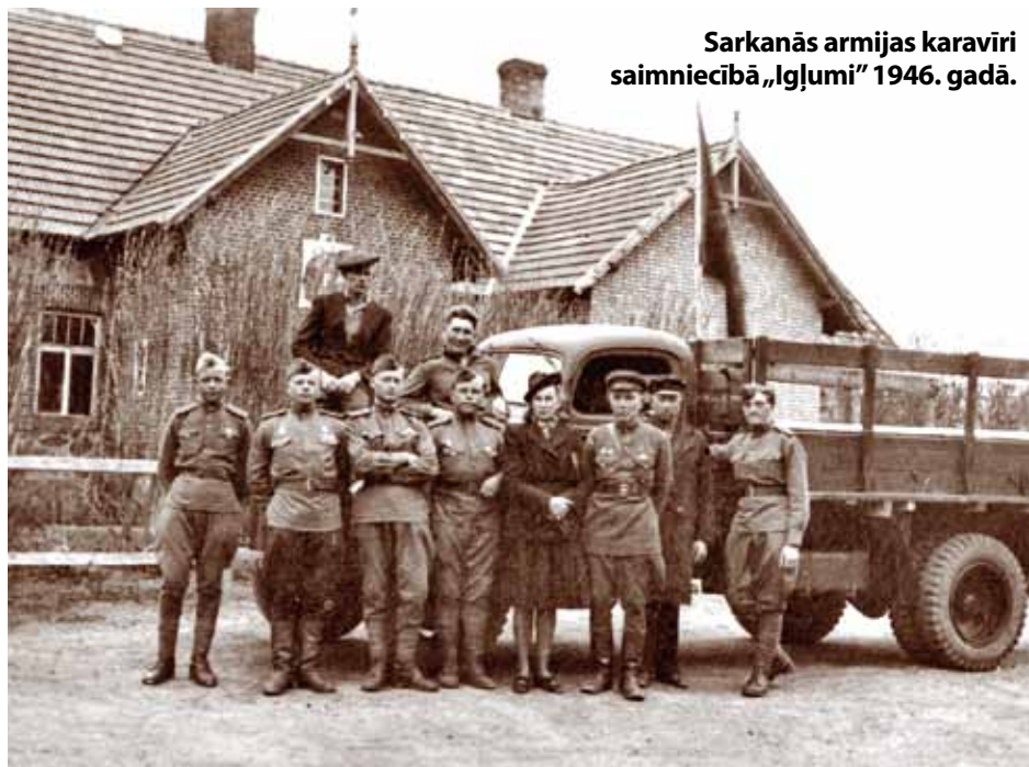
Sarkanās armijas karavīri saimniecībā „Ilgumi” 1946. gadā.