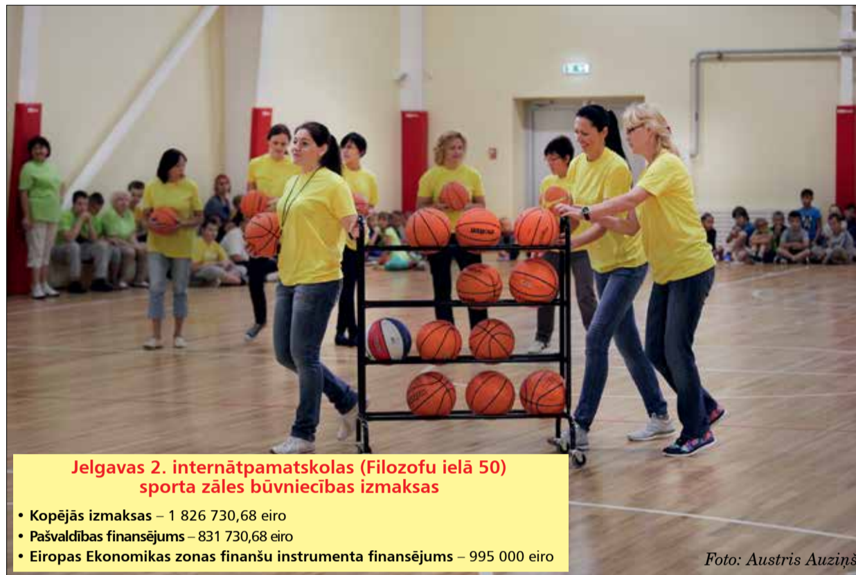
Jelgavas 2. internātpamatskolas (Filozofu ielā 50) sporta zāles būvniecības izmaksas

Jelgavas 2. internātpamatskolas sporta zāle ir Jelgavā pirmā zema enerģijas patēriņa sabiedriskā ēka.