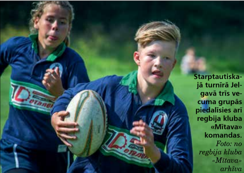
Starptautiskajā turnīrā Jelgavā trīs vecuma grupās piedalīsies arī regbija kluba «Mītava» komandas.