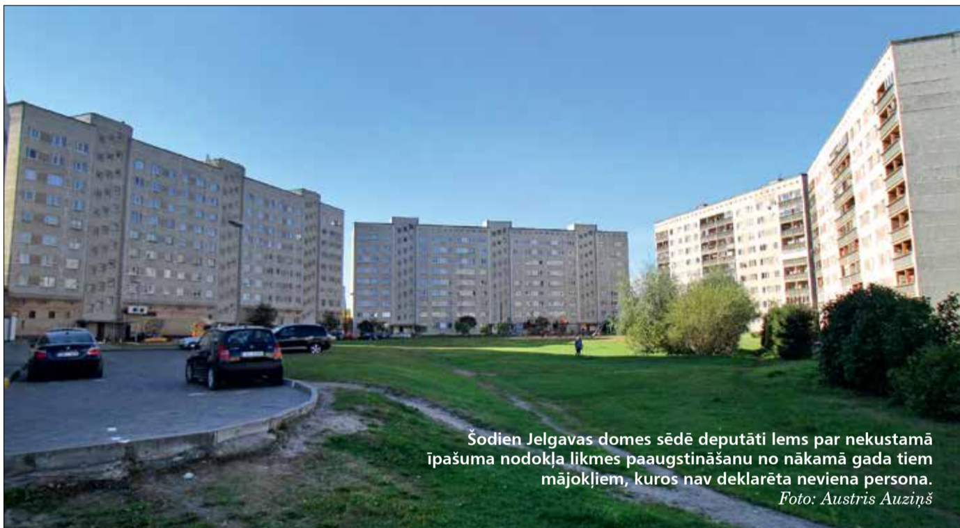
Šodien Jelgavas domes sēdē deputāti lems par nekustamā īpašuma nodokļa likmes paaugstināšanu no nākamā gada tiem mājokļiem, kuros nav deklarēta neviena persona.