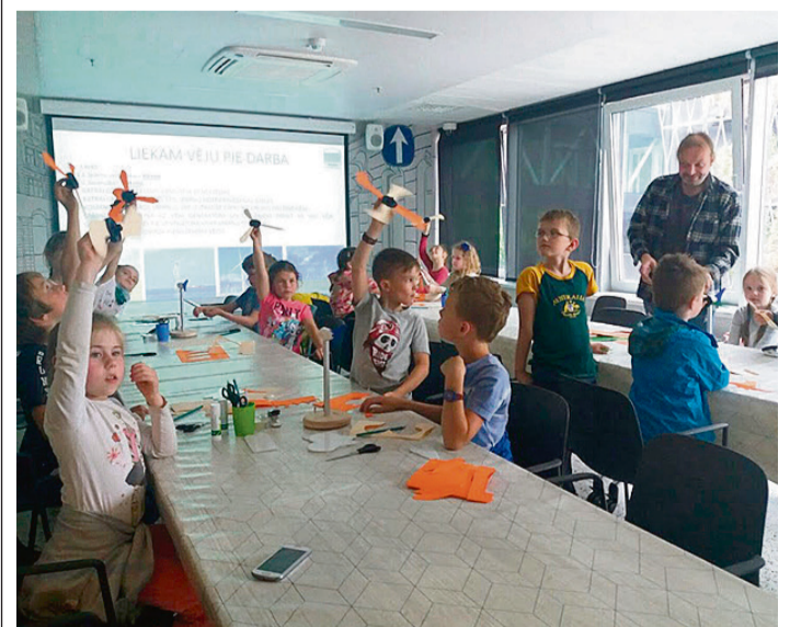
Izziņas un eksperimentu centrā „Lielvārde”.