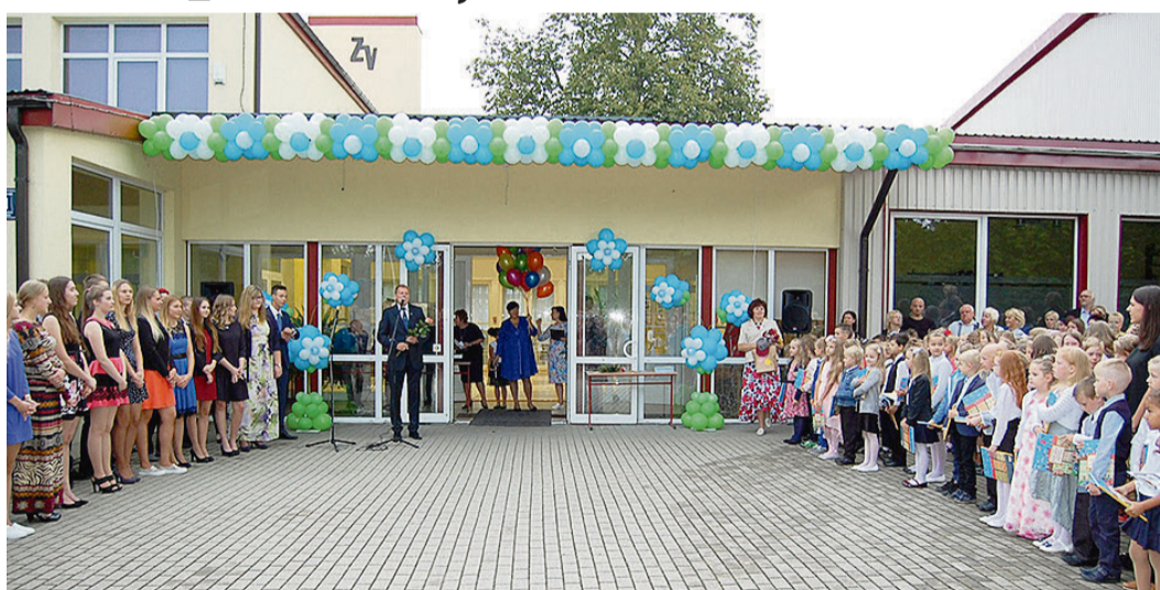
1. septembra svinīgais pasākums Zvejniekiema vidusskolā.

2017./2018. m. g. Zvejniekiema vidusskolā mācības sāka 294 skolēni, no kuriem pirmsskolā mācīsies 6 audzēkņi, bet 1.a un 1.b klasē zinības apgūs 34 skolēni, savukārt 12. klasē mācības turpinās 18 jaunieši. Šajā mācību gadā 3. un 4. klase piedalīsies projektā „Sporto visa klase”, bet 10. klases skolnieks mācās ASV skolēnu apmaiņas programmas „FLEX” ietvaros, apgūstot svešvalodu un kultūru.