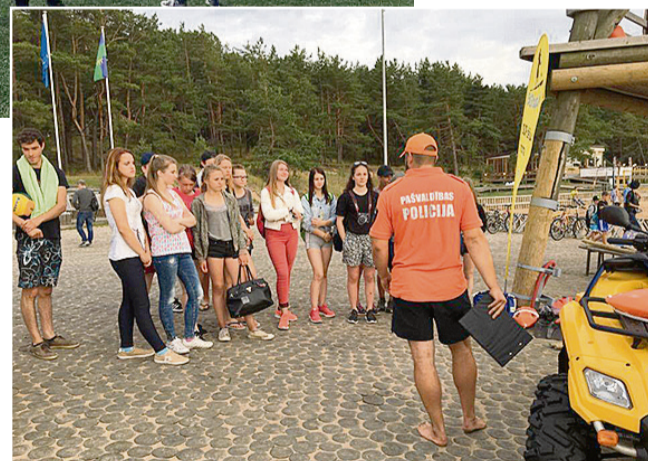
Ciemos pie Saulkrastu glābšanas dienesta.

interesantākā bija tikšanās ar Saulkrastu glābējiem, kuri iepazīstināja ar savu darbu un izvizināja ar kvadraciklu. Nav šaubu, ka Jauniešu mājas un Rūjienas Jauniešu iniciatīvu centra draudzība un sadarbība ir tikai sākusies.