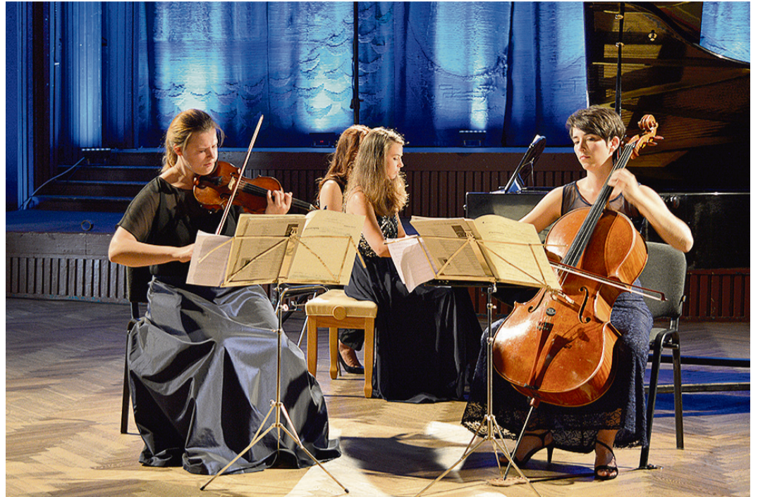
Trio „Sōra” koncerts kultūras namā „Zvejniekiems”.

Vēl viena skaista tradīcija – katru gadu koncertciklu laikā notiek viena skaņdarba pirmatskaņojums. Šoreiz tas bija Asijas Ahmet-