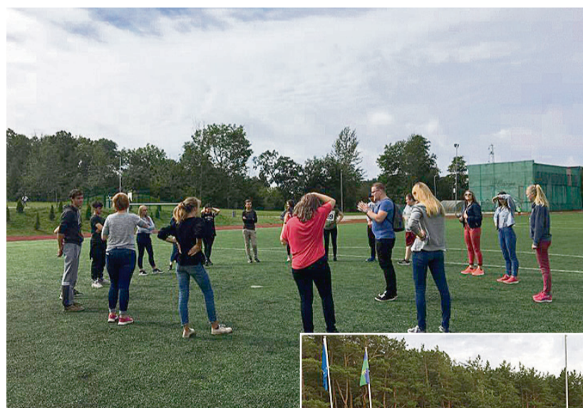
Abu novadu jaunieši iepazīstas.

interesantākā bija tikšanās ar Saulkrastu glābējiem, kuri iepazīstināja ar savu darbu un izvizināja ar kvadraciklu. Nav šaubu, ka Jauniešu mājas un Rūjienas Jauniešu iniciatīvu centra draudzība un sadarbība ir tikai sākusies.