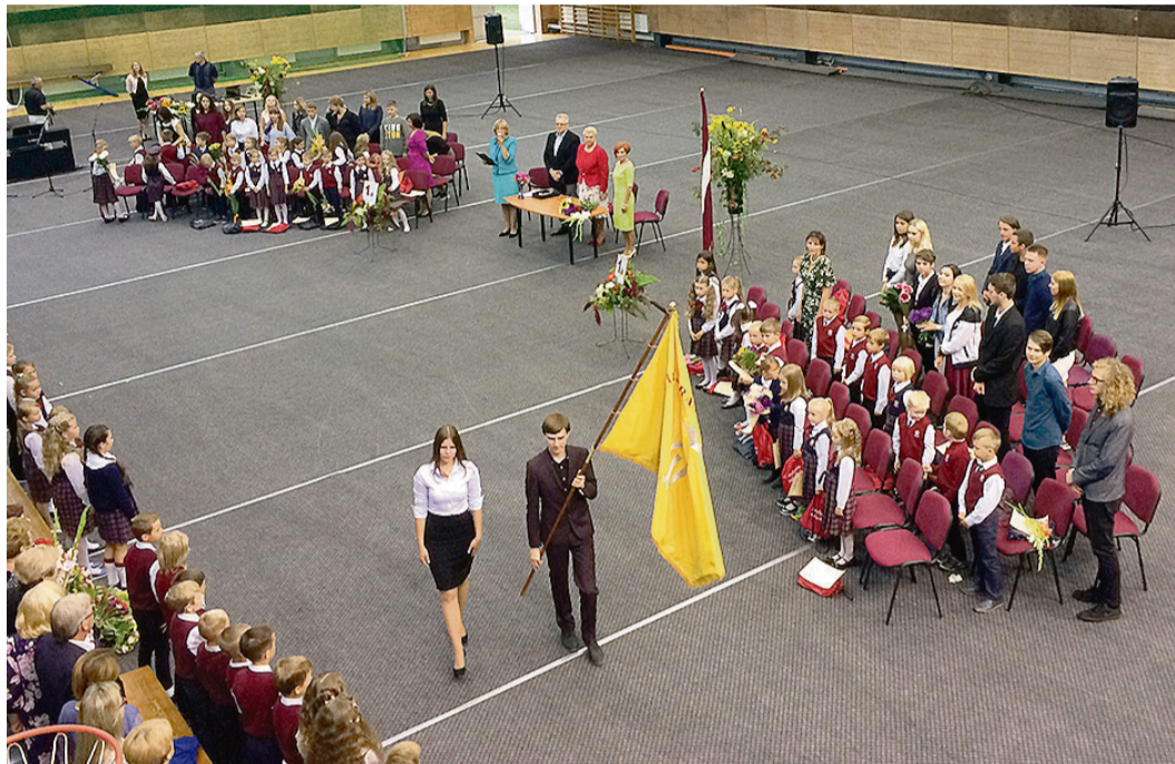
Šogad pirmo reizi svinīgajā pasākumā godā tika celts skolas karogs un atskaņota skolas himna.

1. septembrī - Zinību dienā - Saulkrastu vidusskolas durvis vēra 377 skolēni. To vidū bija 37 pirmklasnieki, kā arī 40 vidusskolēni. Šogad pirmo reizi svinīgajā pasākumā godā tika celts skolas karogs un atskaņota skolas himna.