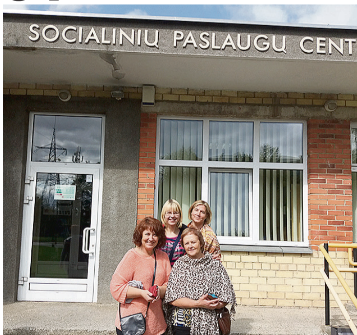
Sociālā dienesta darbinieces pieredzes apmaiņā Šauļos.

Pieredzes brauciena laikā bija tikšanās ar aprūpes iestāžu vadītājiem un darbiniekiem, kuru noslēdza informatīvs seminārs – diskusija par sociālajiem pakalpojumiem. Tika apmeklēts Šauļu pilsētas pašvaldības Sociālo pakalpojumu centrs un tā struktūrvienības – Ģimenes atbalsta pakalpojumu māja un patversme, kura nodrošina naktsmājas pieaugušajiem krīzes situācijās, kad pastāv draudi cilvēka veselībai