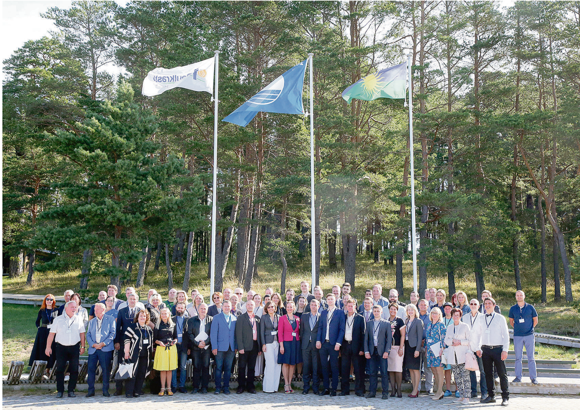
Saulkrastu uzņēmēju brokastis pulcēja lielu skaitu uzņēmēju, kas vēlas Saulkrastiem dot jaunu enerģiju.

Saulainā 31. augusta rītā Saulkrastos, Jūras parka kafejnīcā „Mare” terasē, jaundibinātā Saulkrastu uzņēmēju biedrība organizēja uzņēmēju brokastis, lai sabiedrību iepazīstinātu ar saviem mērķiem, piesaistītu jaunus biedrus un veicinātu Saulkrastu attīstību.