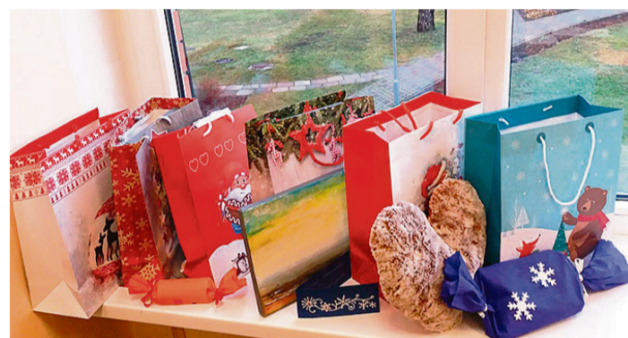
Saulkrastu vidusskolas 3.b klases dāvanas ārpusģimenes aprūpē esošajiem bērniem.