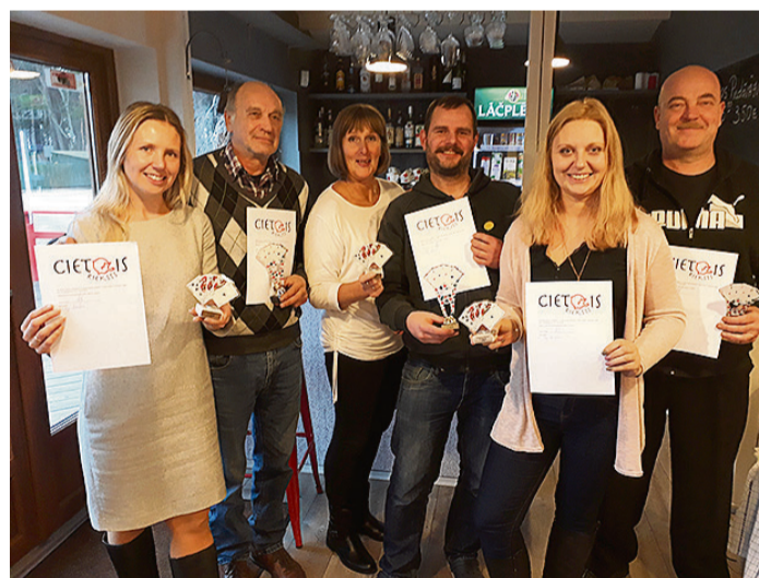
Zolītes čempionāta pirmais trijnieks dāmām un kungiem.

Galda tenisa čempionātā jau pirms pēdējā posma kļuva