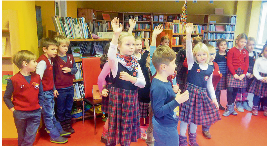
Saulkrastu vidusskolas 1.a un b klases skolēni izspēlē spēli „Četri stūri”.

Kopumā jauniešu noskaņojums, lai gan bieži orientēts uz problēmām, ir vērstas arī uz iespēju pašiem mainīt un uzlabot vidi sev apkārt. Kampanā piedalījās Saulkrastu vidusskolas 1.a, 1.b, 2.a, 2.b, 3.a, 3.b, 4.a, 4.b un 6.b klases skolēni, kā arī Zvejniekiema vidusskolas 6. un 7. klašu skolēni.