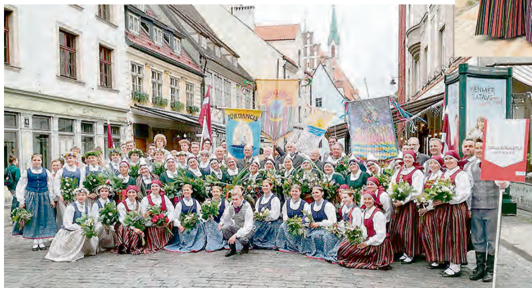
Saulkrastu novada dejojāji.

Saulkrastu novada dome saka lielu paldies svētku dalībniekiem, kolektīvu vadītājiem, palīgiem un atbalstītājiem, visiem, kuri godam nesa Saulkrastu novada vārdu, padarot šos īpašos svētkus neaizmirstamus.