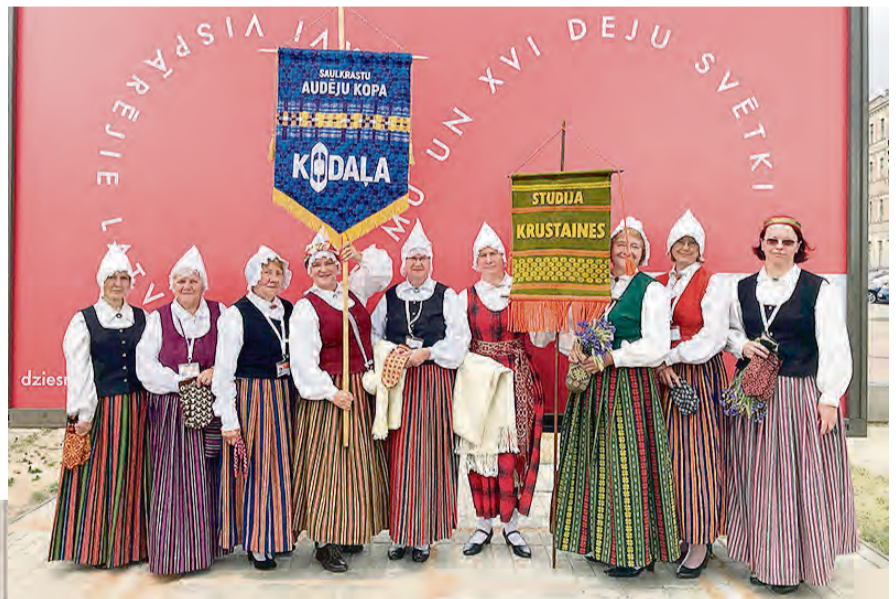
Audēju kopas „Kodaļa” un rokdarbu studijas „Krustaines” dalibnieces. Publicitātes foto