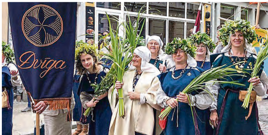
Folkloras kopas „Dvīga” dziedātājas.