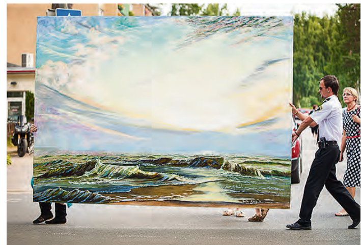
Plenērā tapušas gleznas ceļojums no molberta pa Saulkrastiem. Šoreiz palīgā nākusi pašvaldības policija.