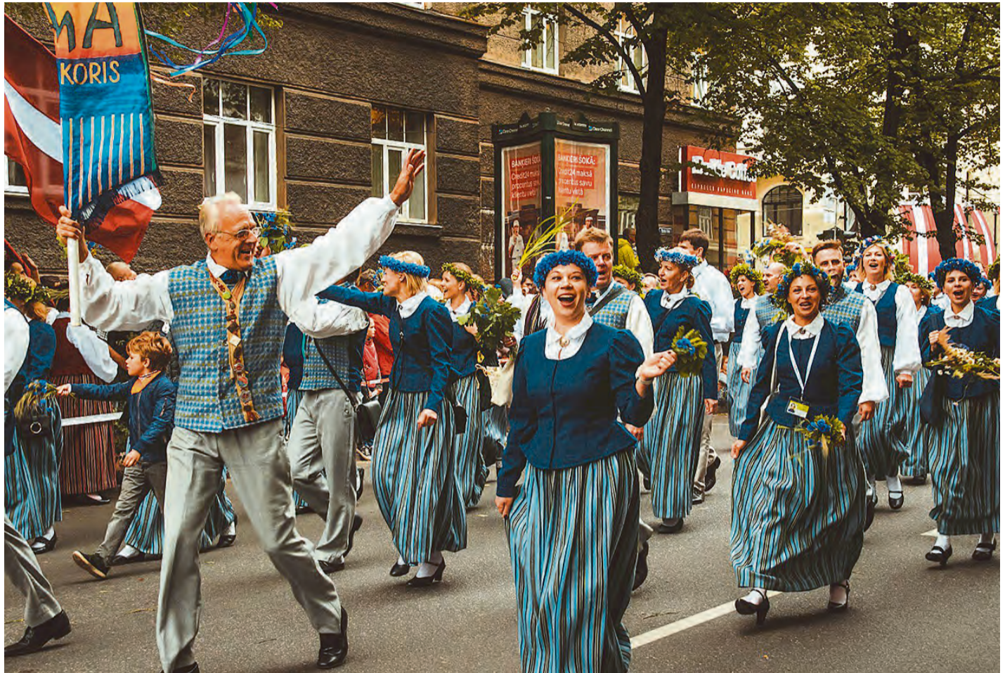
Jauktais koris „Anima” svētku atklāšanas gājienā.