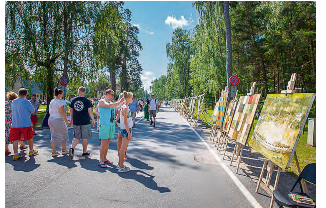
Līdz ar gleznotāju plenēru Saulkrastos ienākusi arī brīvdabas izstāžu tradīcija – gleznu iela. Parasti tā tiek atvērta pilsētas svētkos, kas sakrīt ar gleznotāju plenēra noslēgumu.

Ikdienā vairāk esmu portretists un vērgi skatos uz cilvēkiem. Un atkal vēl viens ieguvums – kad atbrauc uz tādu plenēru, satiec gadu neredzētus cilvēkus un redzi, cik tuvi viņi tev patiesībā ir, jo atkal ir par ko parunāt. Pārējā laikā jau katrs ir aizņemts ar saviem darbiem un pieņemtiem un satiekies iznāk tikai tā, ātri garāmejojot. Tas ir būtiski