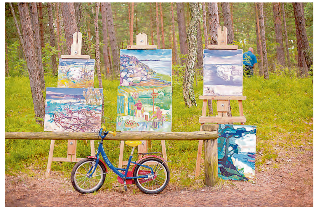
No dabas ņemtie impulsi pārvērtušies gleznās un uz brīdi atgriezušies Baltajā kāpā.

ne tikai man kā māksliniekam, bet arī kā cilvēkam. Ja par tiem pieminētajiem ikdienas darbiem un rūpestiem, tad tik tiešām tā ir brīnišķīga iespēja, nedomājot par ikdienišķām lietām, nodoties tikai gleznošanai. Vārbut man kā virietim tas nav tik svarīgi, bet sievietēm, uz kuru pleciem parasti ir sagūlies vairāk mājās darbu, gan. Kāda tur bezrūpīga gleznošana, ja jāstāv pie plīts,” atzīst gleznotājs.