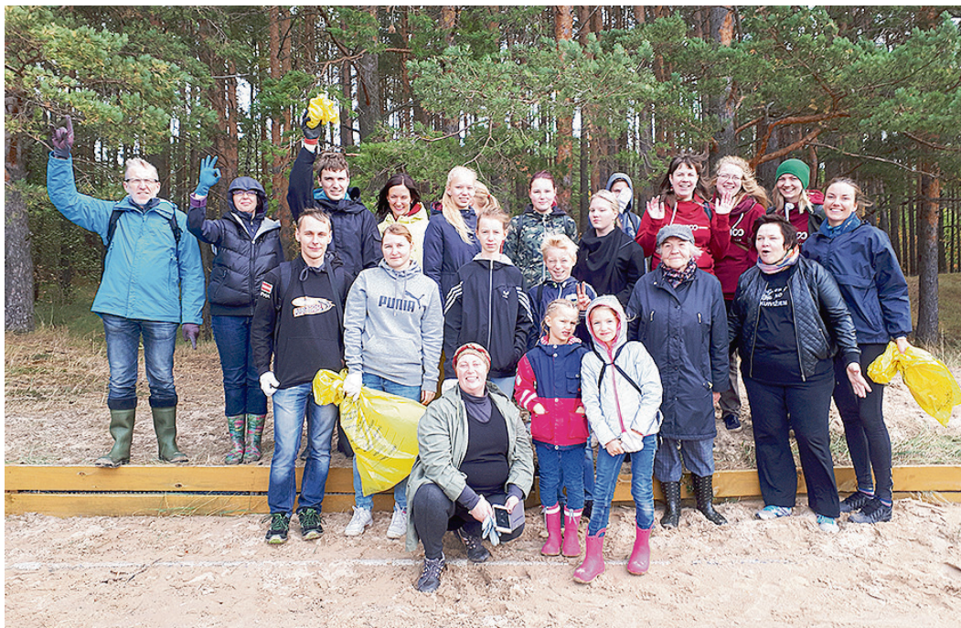
Piekrastes uzkopšanas talkas dalībnieki.

Interesants izvērtās Dzejas dienu noslēguma un Bērnu un jauniešu žūrijas grāmatu kolekcijas 2018 atvēršanas pasākums, kas notika 27. septembrī. Šogad 1.–4. klases skolēni mācījās dzejoļus par rudeni un veidoja atbilstošas kompozīcijas no dabas materiāliem. 1. klases skolēni runāja dzejoli „Ezītis” un izveidoja ežu ģimeni, kurā bija tikpat dalībnieku, cik klasē skolēnu; 3. a klase sagatavoja kompozīciju „Ābele” un deklamēja Raiņa dzejoli „Praktiskais zēns un rudens”, bet 4. klases skolēni no dabas materiāliem izgatavoja putnus, ilustrējot dzejoli „Zilīte”. Visu sākumskolas klašu skolēni bija ļoti