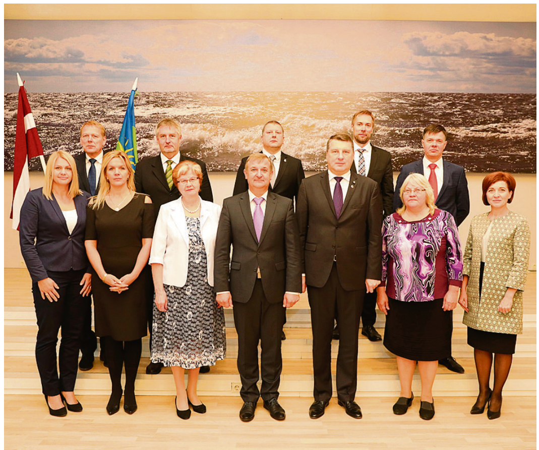
Valsts prezidents kopā ar Saulkrastu novada domes deputātiem un administrācijas pārstāvjiem.