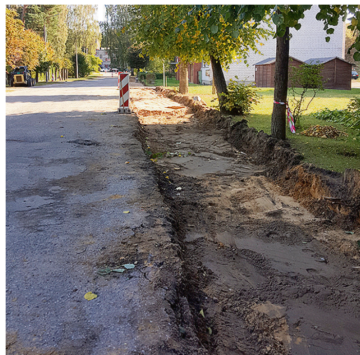
Būvdarbi L. Paegles ielā.

tvers asfaltbetona frēzēšanu, jaunā seguma ieklāšanu, nomaļu uzstādīšanu, tajā skaitā arī lietusūdens uztvērējaku tīrīšanu un skataku remontu, un regulēšanu. Būvdarbu izmaksas – 49 187,77 eiro. Darbus plānots pabeigt oktobra beigās.