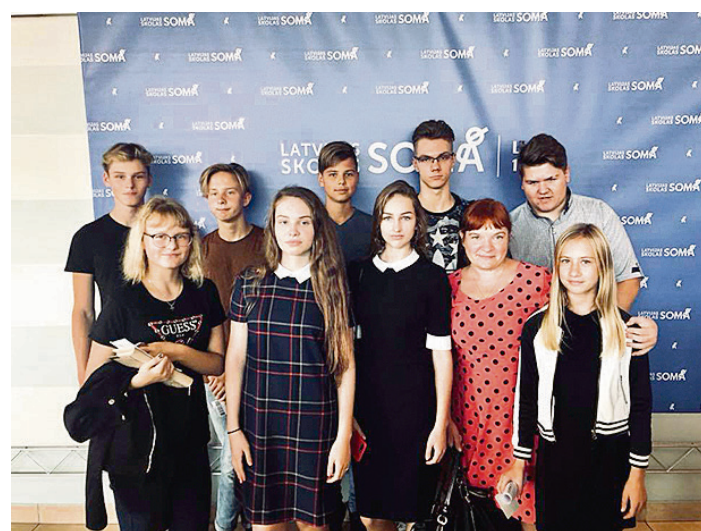
Skolēni pasākumā „Latvijas skolas soma”.

Kā jauniešiem iesaistīties dzimtas pilsētas sabiedriskajā dzīvē, piešķirt tai jaunības degsmi un dinamismu? Uz šiem jautājumiem atbildes un idejas tika meklētas gan Saulkrastu vidusskolas skolēniem tiekoties ar „Jauniešu