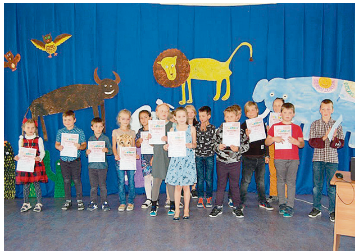
Sākumskolas skolēni dzejas dienu noslēgumā.

Septembris ir mācību gada pirmais mēnesis, tādēļ to var uzskatīt arī par jaunu iespēju mēnesi, jo Zvejniekiema vidusskolā pilnā sparā sākās mācību darbs, kā arī skolēniem bija iespēja piedalīties dažādos skolas un ārpuskolas pasākumos.