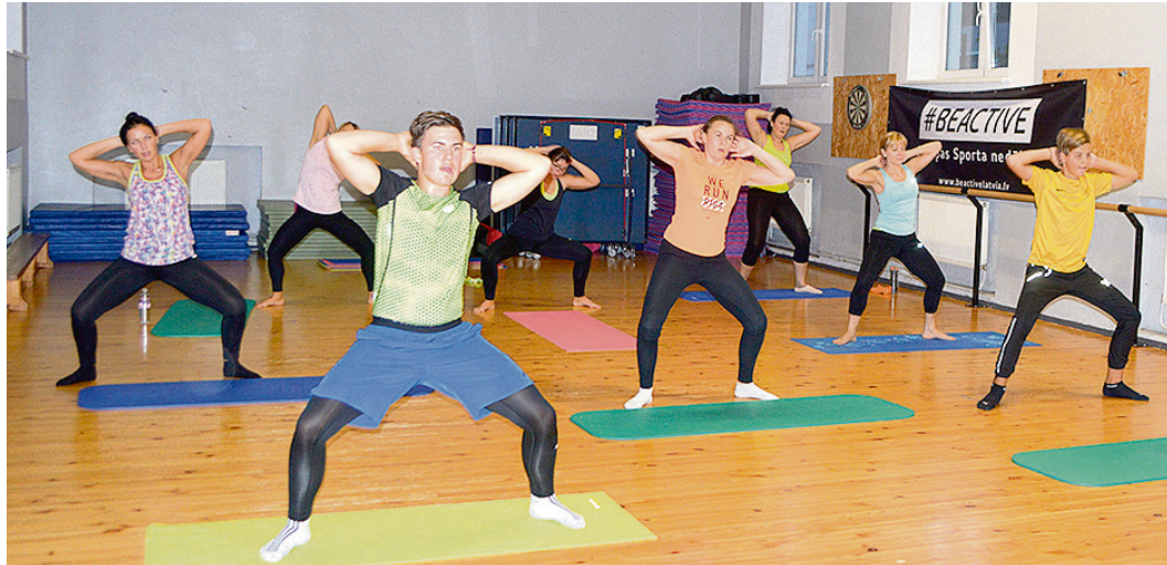
Fiziskās izturības treniņš.

No 23. līdz 30. septembrim Saulkrastos notika Eiropas sporta nedēļa. Tās laikā iedzīvotājiem bija iespēja apmeklēt dažādas sporta aktivitātes.