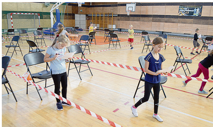
Orientēšanās sporta mācības Saulkrastu sporta centrā.

Sestdien sporta centrā iedzīvotājiem bija iespēja izmērīt asinsspiedienu un cukura līmeni asinīs pie ģimenes ārsta un noklausīties divas lekcijas: vienu par veselīgu uzturu un otru par asinsspiedienu. Visās trijās izglītības iestādēs bērniem bija iespēja apgūt orientēšanās sporta pamatus caur labirintiem. Vislielākais pieprasījums bija pēc uztura speciālista konsultācijām, kurās visu nedēļu bija iespēja veikt dažādus mērījumus ar ķermeņa masas analizatoru