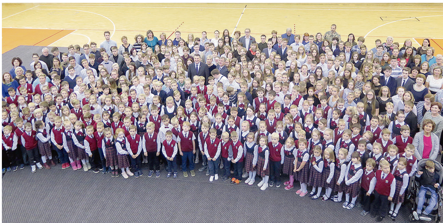
Saulkrastu vidusskolas skolēni un pedagogi ar Latvijas Valsts prezidentu Raimonu Vējoni.

Septembrī notika arī sportiskās aktivitātes, kuru lielākā vērtība – piedalīties un darīt visiem kopā, veicinot veselīgu dzīvesveidu. Olimpiskajā dienā, 21. septembrī, kopīgi vingrojām skolas stadionā un pierādījām savus spēkus un veiklību rudens krosā. Labākie skrējēji pārstāvēja skolu sacensī-