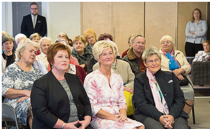
I. Vējone tikšanās laikā ar Saulkrastu senioriem.