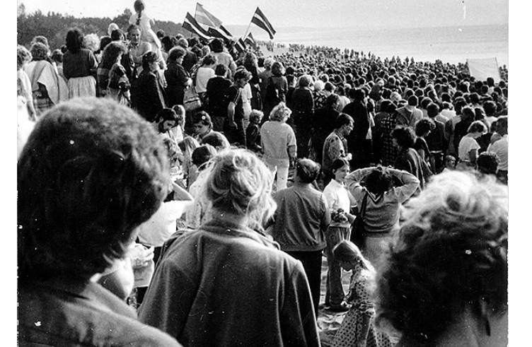
Aizlūgums, pie jūras. Saulkrastiešiem bija skaidrs, ka ar to vien nekas nebeigsies.