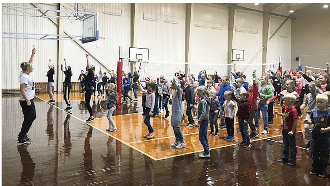
Rīta vingrošana sporta nedēļā.

centušies un sagatavojušies Dzejas dienu noslēgumam.