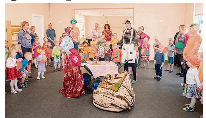
Miķeļdienas svinībās piedalījās arī Valsts prezidenta kundze.