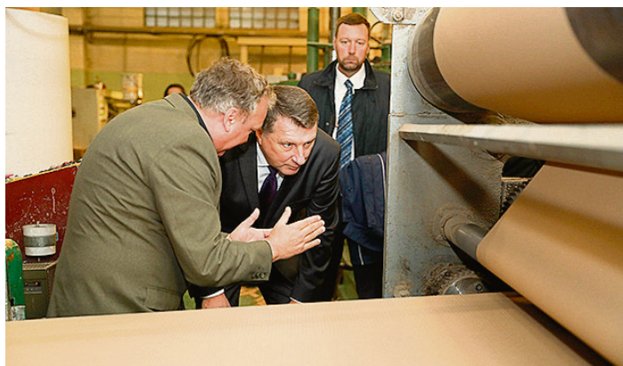
R. Vējonis iepazīstas ar SIA „Skultes kartons” ražotni.

Savukārt prezidenta kundze tikās ar Saulkrastu pensionāru biedrības pārstāvjiem, apmeklēja Sociālās aprūpes māju un ciemojās pirmsskolas izglītības iestādē „Rūķītis”. Vizītes foto galerija apskatāma vietnē www.saulkrasti.lv