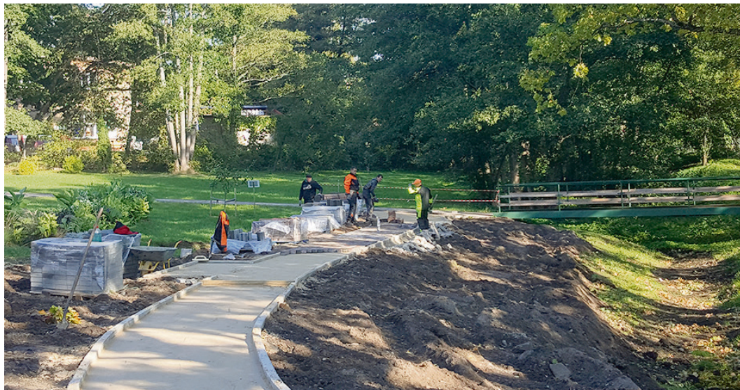
Labiekārtošanas darbi simtgades skvēriņā.

Uzlabojot pašreizējo vides infrastruktūru un turpinot uzsāktos labiekārtošanas darbus, kā arī, lai nodrošinātu ērtu pārvietošanos, skvēriņā pie pagājušā gada novembrī uzstādītā Latvijas karoga masta sākti gājēju celiņa būvdarbi.