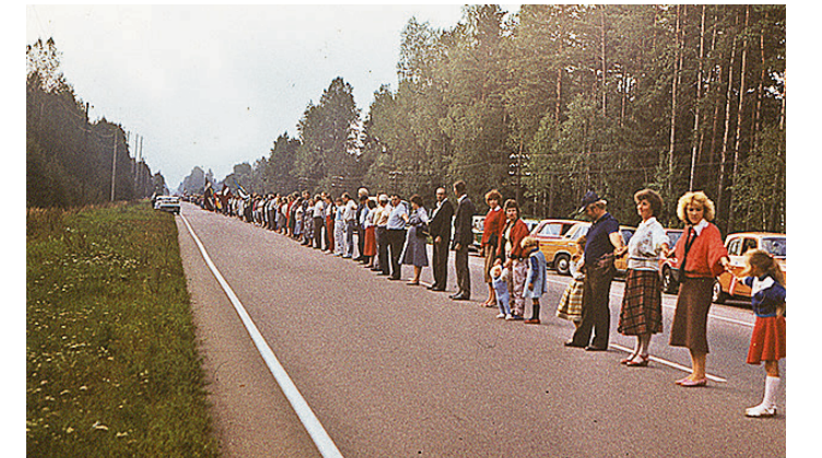
Saulkrastieši Baltijas ceļā.