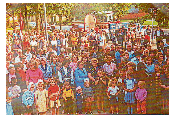
Karoga pacelšana virs aptiekas ēkas Ainažu ielā 10 pulcēja visu paaudžu saulkraściešus.