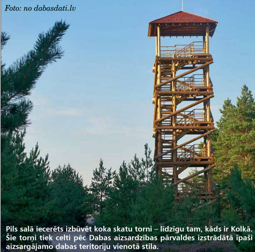
Pils salā iecerēts izbūvēt koka skatu torni – līdzīgu tam, kāds ir Kolkā. Šie torņi tiek celti pēc Dabas aizsardzības pārvaldes izstrādātā īpaši aizsargājamo dabas teritoriju vienotā stila.