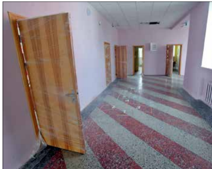
Jau vairāku vasaru garumā pārmaiņas piedzīvo Jelgavas 3. sākumskolas telpas, kur norit gaitēņu vienkāršotā atjaunošana. Šovasar tiek remontēts 4. stāva gaitenis, bet nākamgad plānots uzsākt skolas kāpņu un kāpņu telpu remontu.