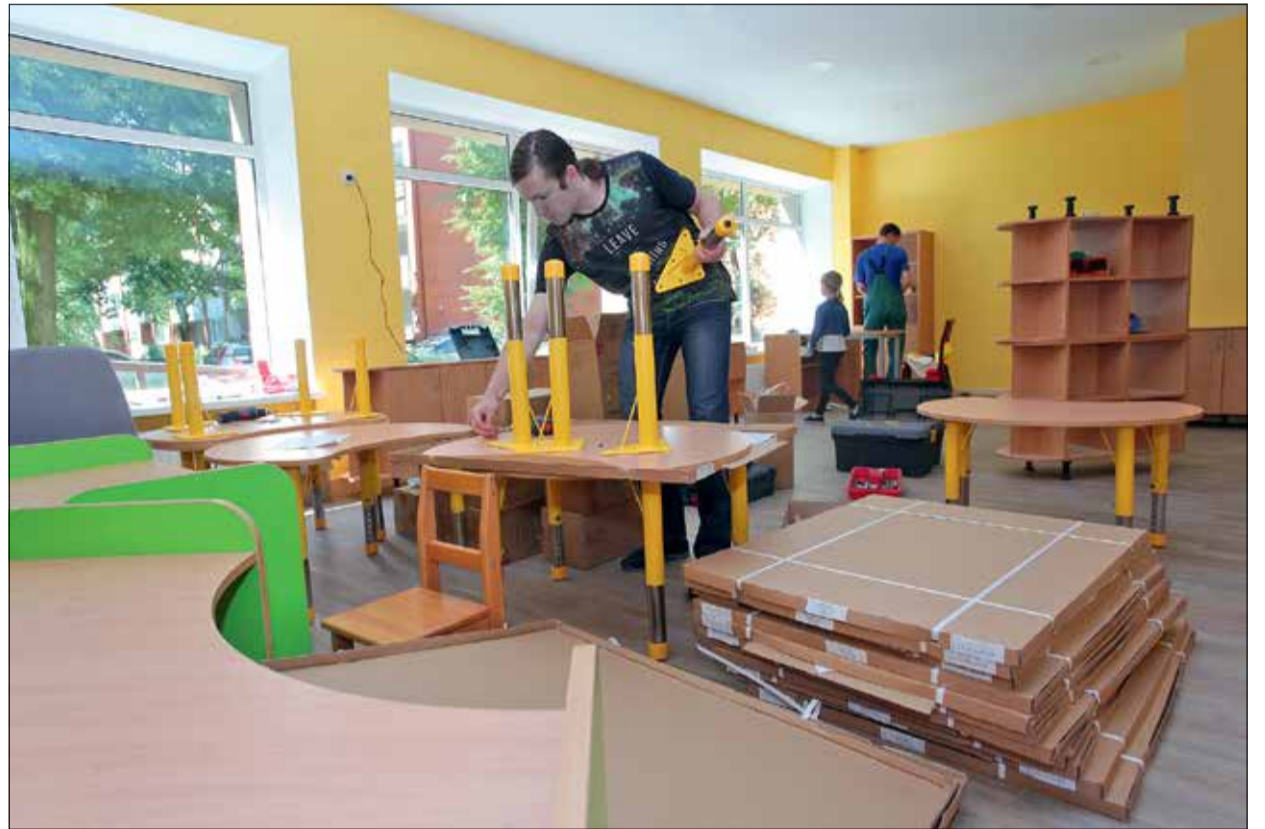
Pirmsskolas izglītības iestādē «Lācītis» šovasar atjaunotas vienas grupiņas telpas – izremontēta guļamtelpa, ēdamzāle, virtuvīte un sanitārais mezgls. Tāpat darbi šovasar norit arī bērnudārza teritorijā. «Lācīša» ziemeļu un austrumu daļā plānots nomainīt žogu, izveidot iebraucamos vārtus un gājēju vārtiņus, kā arī nojaukt pirmsskolas izglītības iestādē esošo pagrabu.

Līdztekus remontdarbiem un projektēšanas darbiem izglītības iestādēs turpinās arī siltummezgla sagatavošana jaunajai apkures sezonai, ēku energosertifikācija un tehniskā apsekošana. Līdz 2019. gadam plānotam veikt pilnīgi visu iestāžu tehnisko apsekošanu, lai apzinātu reālo stāvokli un plānotu nākotnes darbus,» norāda izglītības pārvaldes galvenais speciālists būvniecības un ēku apsaimniekošanas jautājumos.