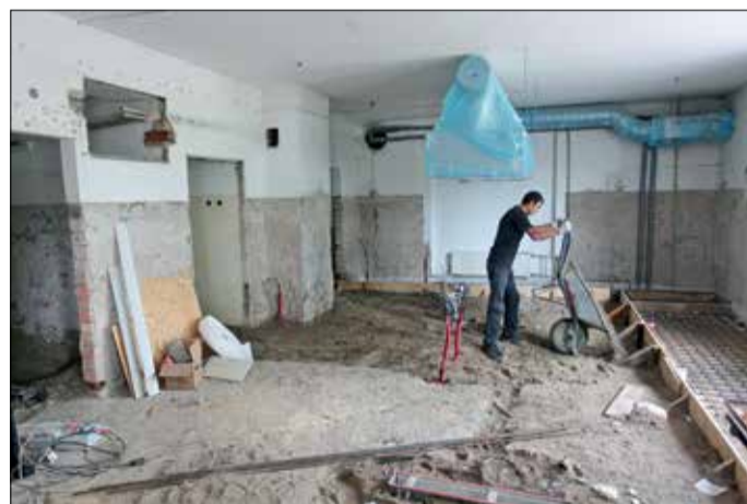
Vieni no sarežģītākajiem remontdarbiem – ēdināšanas bloku vienkāršotā atjaunošana – šogad notiek Jelgavas 2. pamatskolā un 2. internātpamatskolā. Abās izglītības iestādēs darbi norit ražošanas zonā jeb virtuvē, kur tiek atjaunotas komunikācijas, pielāgojot tās mūsdienu sanitārajām prasībām, kā arī telpas piedzīvo vizuālas pārmaiņas. Jāatgādina, ka 2. pamatskolā notiek ēdināšanas bloka remontdarbu 2. kārtā – pērn tika paplašināta skolas ēdamzāle. Savukārt 2. internātpamatskolā darbi pie ēdamzāles pārbūves plānoti nākamgad.

Bērnudaržā «Rotaļa» šogad plānots īstenot remontdarbu 6. kārtu, ietverot ēkas siltināšanu, apkures sistēmas rekonstrukciju, teritorijas labiekārtošanu, vides pieejamības uzlabošanu un citus remontdarbus. Jāpiebilst, ka rekonstrukcijas darbi šajā pirmsskolas izglītības iestādē aizsākti 2010. gadā.