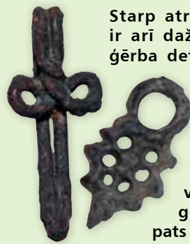
Starp atradumiem ir arī dažādas apģērba detaļas, bet visvairāk – aizdares āķi. Tie bija izplatīti, jo tādus varēja izgatavot mājās.

Akadēmijas ielā labi saglabājusies āda un koks. To apliecina arī šī poga: metāla apvalkā koka lodīte. Šāda poga gan nav pārāk praktiska un, visticamāk, darbojās pēc tāda principa kā aproču pogas.