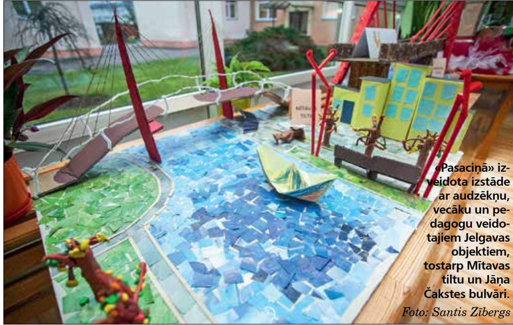
«Pasaciņā» izveidota izstāde ar audzēkņu, vecāku un pedagogu veidotajiem Jelgavas objektiem, tostarp Mītavas tiltu un Jāņa Čakstes bulvāri.