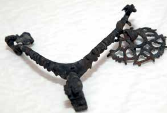
Lietais piesis ar dekoriem lauvas galvas veidolā ir interesantākais Akadēmijas ielā uzietais priekšmets. Tas ir rets 17. gadsimta atradums un liecina, ka zirga īpašnieks bijis turīgs – tajā laikā bagātību demonstrēja, rotājot zirgus un pošoties paši.

Skārda plāksnes fragmenti ar cizelētu ornamentu visdrīzāk ir no sieviešu galvasrotas. Šādi 16.–17. gadsimta vainagi jau agrāk atrasti Jelgavas apkaimē – apbedījumos Vilcē.