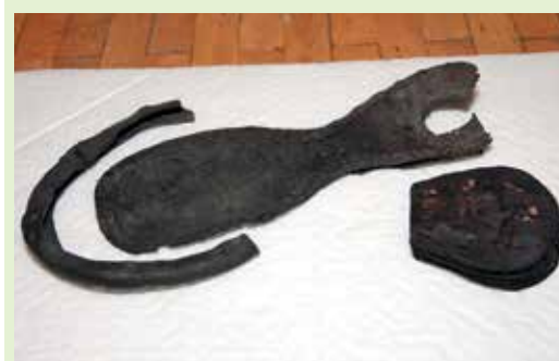
17. gadsimtā apavus izgatavoja no ādas, arī zoles. Kurpes uz 3–5 centimetrus augstiem papēžiem tolaik nēsāja viriēši – tā bija nepieciešamība, jo ceļi bija slikti stāvoklī, turklāt kungu vēlējas izskatīties garāki. Zoles tika izgatavotas, liekot vienu virs otra ādas slāņus un sastiprinot tos ar koka tapiņām.

Akadēmijas ielā atrastie svina ūdensvada un čuguna gāzesvada fragmenti nepārprotami norāda, ka jau 19. gadsimta beigās un 20. gadsimta sākumā Jelgava bija attīstīta un soli priekšā daudzām Eiropas pilsētām.