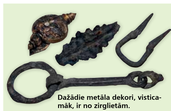
Dažādie metāla dekori, visticamāk, ir no zirglietām.

Akadēmijas ielā labi saglabājusies āda un koks. To apliecina arī šī poga: metāla apvalkā koka lodīte. Šāda poga gan nav pārāk praktiska un, visticamāk, darbojās pēc tāda principa kā aproču pogas.