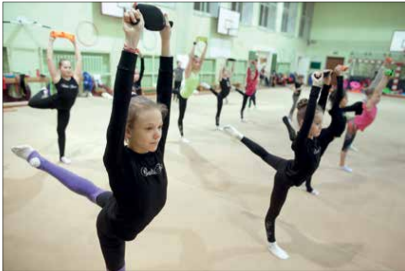
No 23. līdz 25. februārim Jelgavā notiks mākslas vingrošanas sacensības «Baltijas puķē», pulcējot ap 600 vingrotāju. Sacensībām gatavojas arī kluba «Baltic Flower» meitenes.

No 23. līdz 25. februārim Zemgales Olimpiskajā centrā (ZOC) jau devīto reizi notiks starptautiskās mākslas vingrošanas sacensības «Baltijas puķē». Tās šogad pulcēs rekordlielu dalībnieču skaitu – ap 600 vingrotāju –, kas startēs dažādās vecuma grupās. Šis gads īpaši ar to, ka klāt nākusī vēl viena sacensību diena – piektdien pirmo reizi Jelgavā varēs vērot grupu vingrojumus.