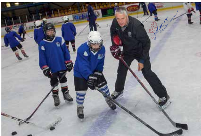
Tas, ka laiku pa laikam audzēkņiem nodarbības vada hokejisti vai treneri ar vārdu, Jelgavas Ledus sporta skolā jau ir ierasta prakse. Pagājušajā nedēļā jaunajiem hokejistiem bija iespēja trenēties pie Latvijas hokeja izlases galvenā trenera Boba Hārtlija, kurš atzinīgi novērtēja to, ko Jelgavā dara – skolo topošos hokejistus un popularizē šo sporta veidu.

Pēc nodarbības uz ledu Jelgavas treneriem bija saruna ar B.Hārtliju, kurā galvenais akcents likts uz spēlētāju motivēšanu un noskaņojumu. «Kāds ir visiedarbīgākais motivēšanas veids? Runāšana. Trenerim jāspēj hokejistu novirzīt pareizā virzienā, pārliecināt un atgādināt, cik svarīgi ir tas, ko viņš dara, kāpēc viņš to dara un ko var sa-