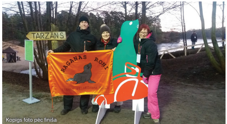
Kopīgs foto pēc finiša

Biedrības "Ziemas peldēšanas kluba "Raganas roņi"" valdes locekle