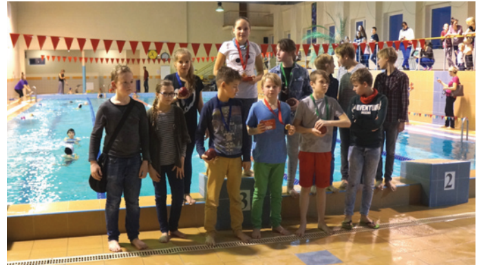
Krimuldas vidusskolas audzēkņi, peldēšanas sacensību medaļnieki

skolēni, gan arī Bērnu un jauniešu attīstības centra "GAUJA" dalībnieki, kas trenējas Inčukalna peldbaseinā.