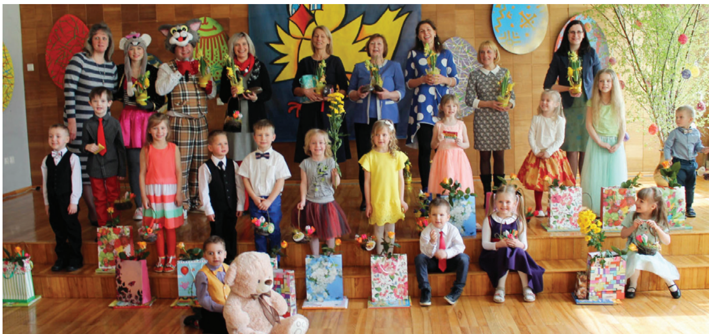
Konkursa "Cālis" organizatori, žūrija, skolotāji, dalībnieki. Priekšplānā uzvarētājs (ar rotaļlāci)

Otrajās Lieldienās Lēdurgas kultūras namā norisinājās mazo vokālistu konkurss „Krimuldas novada Cālis 2017”, kurā piedalījās dziedātāji no 3 līdz 6 gadiem. Šoreiz konkursam bija pieņemti 15 dalībnieki- astoņi no Lēdurgas un septiņi no Inciema.