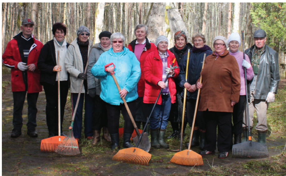
Talcinieki apņēmības pilni sakopt vēl kādu Krimuldas novada vēsturisku objektu