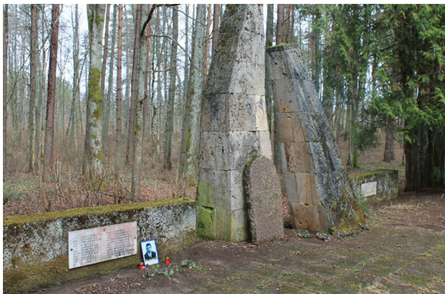
Brāļu kapi, kur apbedīti kritušie Sarkanarmijas kareivji. Nesen pie kapa parādījusies ģimete ar 20 gadīgu kareivi, kurš šeit kritis un apbedīts

viņmēr šeit devās sakopt apkārtni, tad ilgu laiku neviens to nedarīja. Tagad Turaidas pensionāru kopa aktualizē šo objektu, jo aizvien atrodas kādi kritušo tuvinieki, kuri gan privātā kārtā, gan tūristu grupās meklē šo Brāļu kapu apbedījumu vietu.