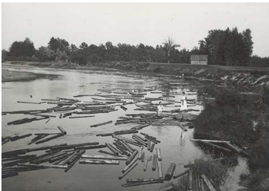
Vaļēji puldinātie baļķi Gaujā pie Strenčiem.

Tradīciju burtnīca “Gaujas plostnieki” pieejama Krimuldas novada bibliotēkās, to iespējams iegādāties Siguldas Tūrisma informācijas centrā un pasūtīt mājas lapā www.serde.lv .