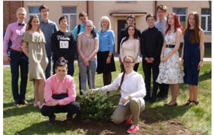
9. klase Pēdējā zvana pasākumā pie iestādītās eglītes skolas pagalmā