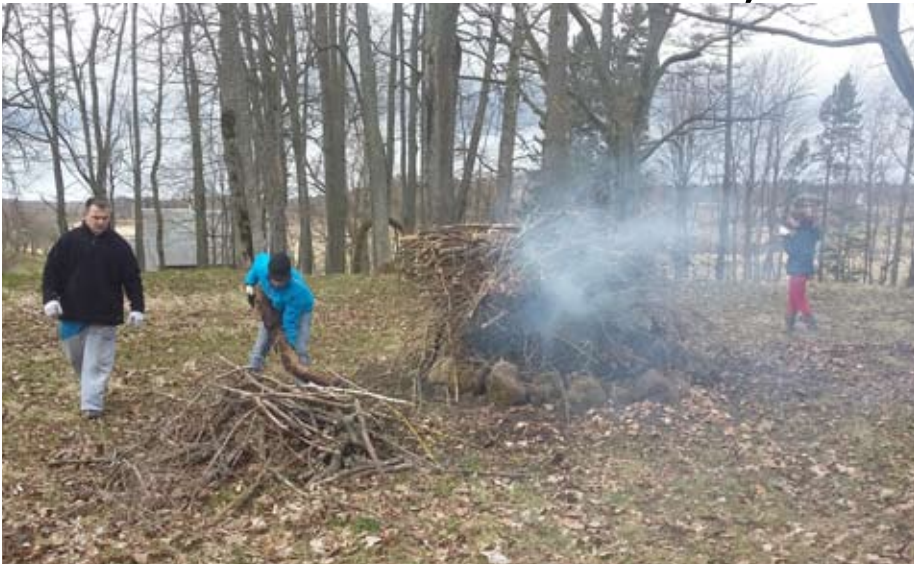
Talcinieki, apliecinot savu piederību un mīlestību Lēdurgai

Pēc garās ziemas, kad vakari gari un tumši, grāmatas izlasītas, ideju pilna galva, tās rosīties rosās, lai tiktu realizētas. Ir pienācis laiks, kad rosās daba, dzīvība un ļaudis. Koku stumbros un cilvēku dzīslās sakrājies spars. Dienas kļuvušas garākas, saule uzrāpusies augstāk debesīs. Pirms cīruļu treļļiem un lakstīgalu pogošanas, dzērvju klaigas un zosu spārnu švīkstī vēstīja, ka līdz ar gājputniem ir atgriezies launaga laiks. Tas nozīmē, ka jāķeras pie darba rīkiem, pie ideju realizēšanas.