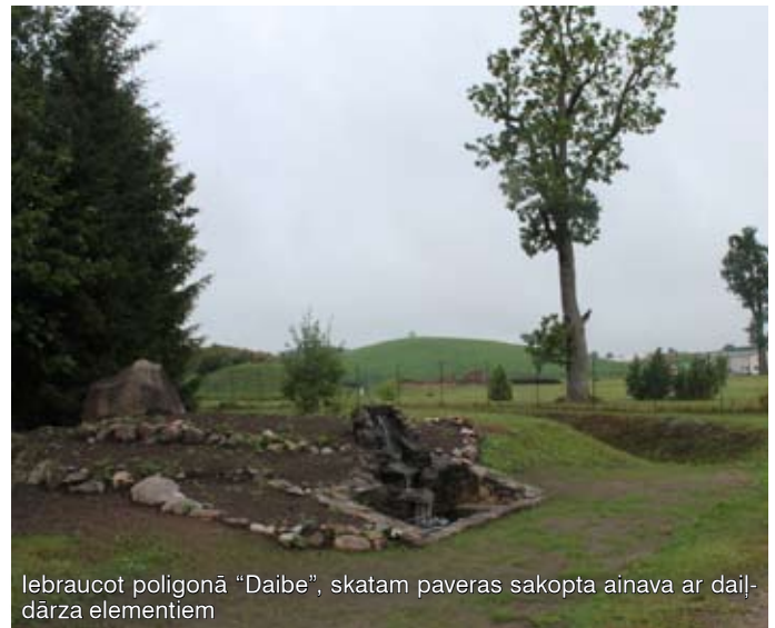
Iebraucot poligonā "Daibe", skatam paveras sakopta ainava ar daļi-dārza elementiem