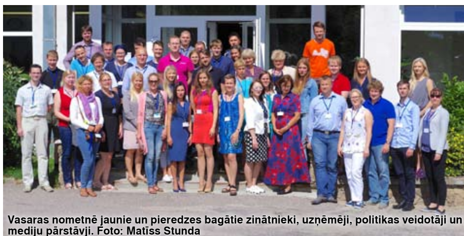
Vasaras nometnē jaunie un pieredzes bagātie zinātnieki, uzņēmēji, politikas veidotāji un mediju pārstāvji.

Dažādu nozaru speciālisti, tajā skaitā jaunie zinātnieki no Lietuvas un Tadžikistānas, darbnīcās risināja Latvijas uzņēmēju izaicinājumus saistībā ar inovatīvā betona sastāva izveidošanu, trīsdimensiju printeru izmantošanu skolās, upcycled somu materiāla pilnveidi, augstskolas stratēģijas plānošanu un Baltijas zinātnes informācijas sistēmas izveidi. Uzņēmēji augstu vērtē zinātnieku ieguldījumu un plāno tālāku sadarbību valsts tautsaimniecības attīstībai. "Diskusijas nometnē mums deva pārlicē-