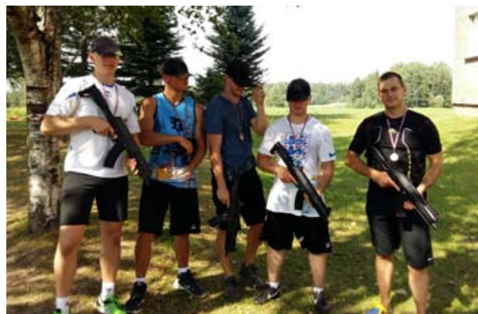
Lāzertag sajūtas vēlējās izjust daudzi