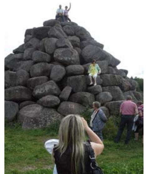
Valpenes piramidālais akmeņu krāvums.