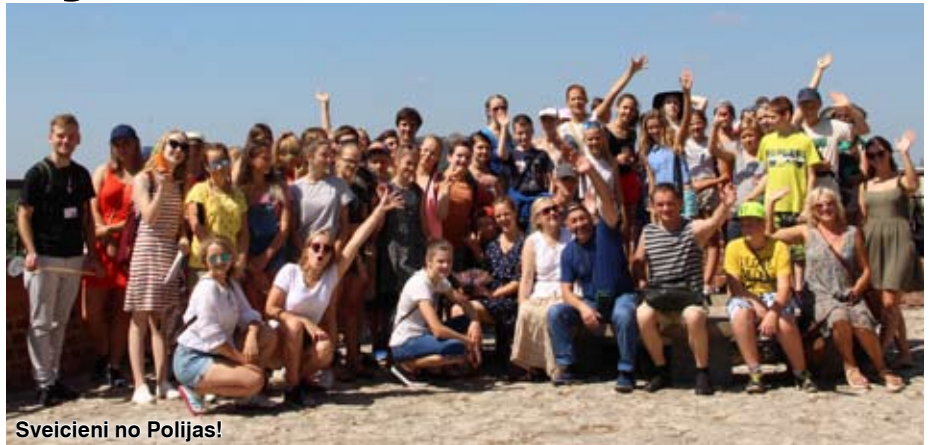
Sveicieni no Polijas!

Brīvajā laikā mēs iepazinām un izbaudījām Polijas kultūru, tās valodu, ēdienu, dabu un folkloru. Vakari neizpalika bez smiekliem, dziesmām un pastaigām pa Krakovas vecpilsētu, kas bija sevišķi apburoša. Tāpat arī pelnītās izpriecas Krakovas ūdens