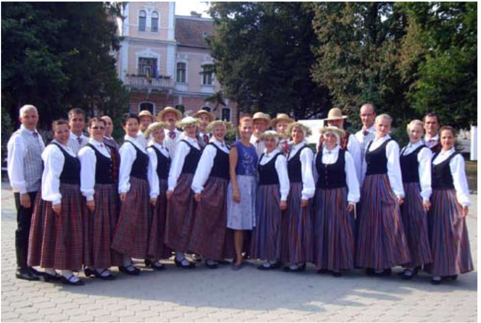
„Dzirnakmeņi” starptautiskajā folkloras festivālā „Folk friends together 2017”

Festivāla ietvaros, „Dzirnakmeņi”, kā vieni no dalībniekiem un kā pārstāvji no Latvijas, piedalījās Ginesa rekorda uzstādīšanas pasākumā. Visi festivāla dalībnieki nostājās iezīmētās Rumānijas kon-