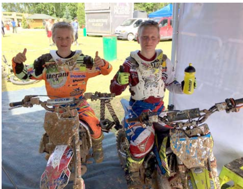
Brāļi Reišuļi pēc sacensībām

“Uz visiem jautājumiem skatos, pirmkārt, no sportista puses, tādēļ arī vairākus gadus organizēju bezmaksas nometnes jaunajiem un perspektīvajiem motosportistiem. Gada laikā tiek izdarīts daudz, lai