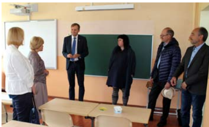
Domes deputāti viesojas Krimuldas vidusskolā