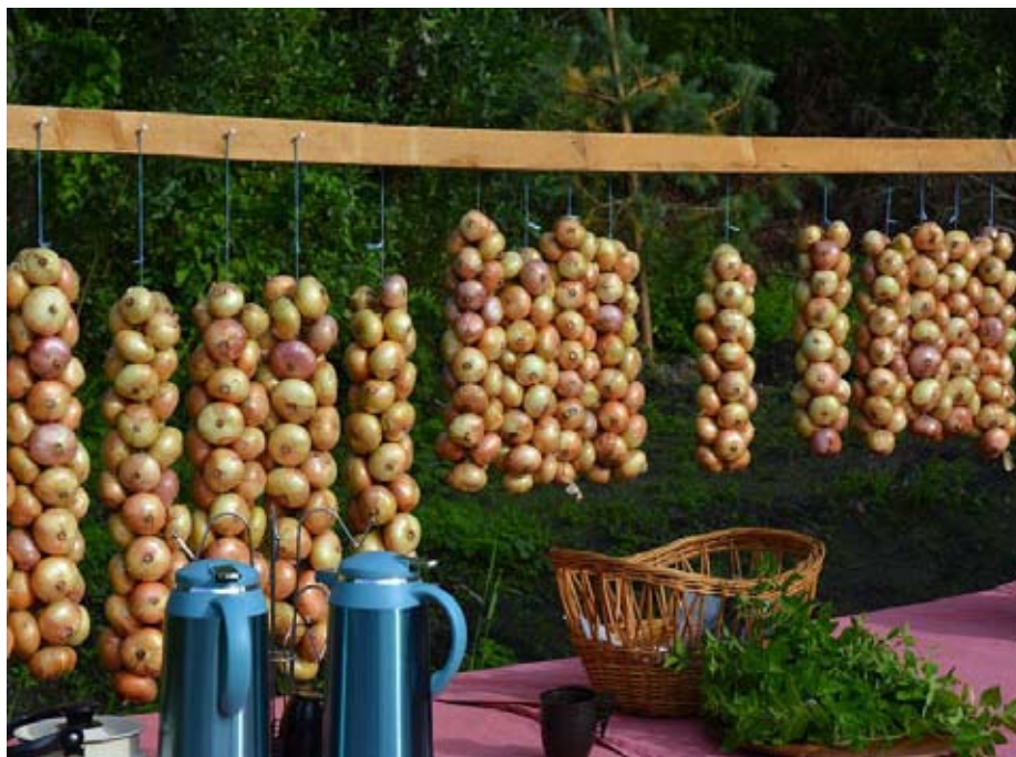
Izrādās, sīpolu audzēšanai šeit ir vismaz 150 gadus sena tradīcija

Latvijas autobusus ar ceļotājiem mums pagādāsies satikt gan Kallastes pilsētā notiekošā ikgadējā “Zivju un Sīpolu gadatirgū”, gan Peipusa krastā dzīvojošo vecticībnieku ciematos, gan pie vietējo sīpolu audzētāja. Izrādās, sīpolu audzēšana šeit ir vismaz 150 gadus sena tradīcija un galvenie nosacījumi ir – to ilgstoša audzēšana bijušā ezera dibenā – dūņu zemē, kur grunts ūdens līmenis un smilšu slānis ir jau zem 40–50 cm. Turklāt ģimenei pie-