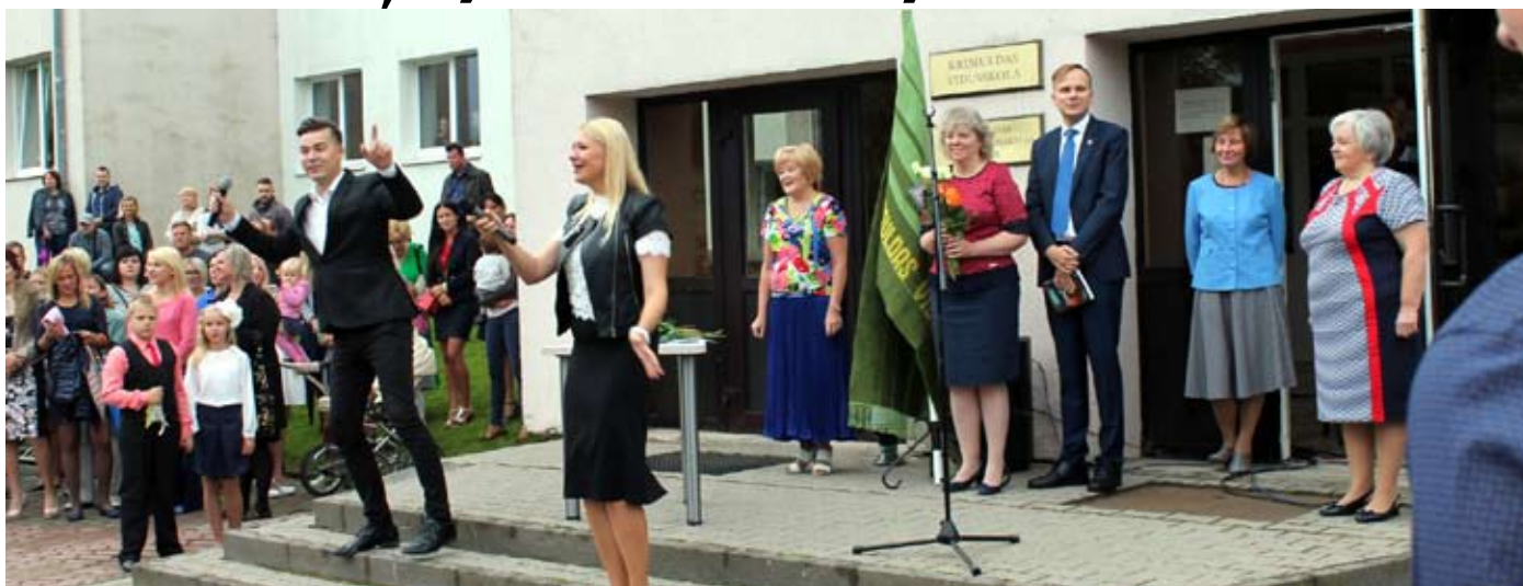
Krimuldas vidusskolā 1.septembris ar skolas un domes vadību, uzstājoties māksliniekiem

Jaunais mācību gads ir sācies. Krimuldas novada domes jaunā sasaukuma deputāti izglītības iestādes apciemoja 25. augustā, lai vēlētu veiksmīgu jauno darba cēlienu un iepazītos ar vasarā paveiktajiem darbiem. Savukārt, KNV lasītāji par katru novada mācību iestādi uzzinās kādā no reportāžām laika gaitā.