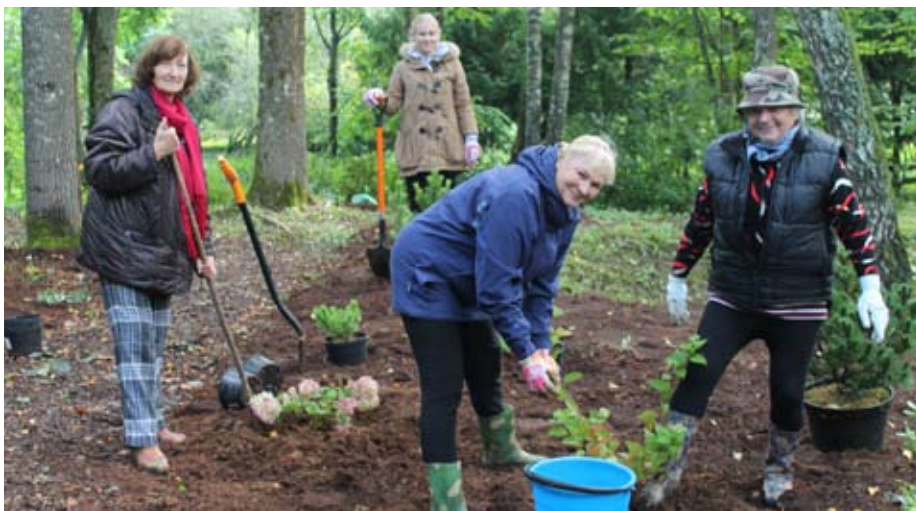
Darbi raiti sokas