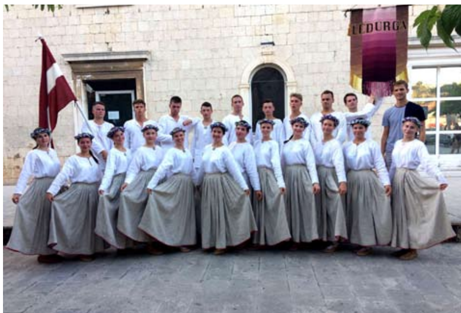
"Metieniņš" ar lielu atbildības sajūtu, apzinoties, ka prezentējam savu Latviju un veidojam pirmo iespaidu

Pirms koncerta vecpilsētas laukums, kurā paredzēta uzstāšanās, bija diezgan tukšs, taču līdz ar koncerta sākumu arī skatītāju