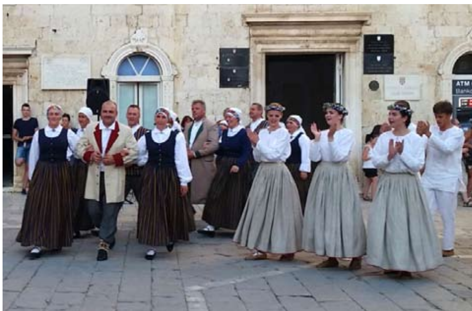
Koncertā vecpilsētas laukumu pildīja gan vietējie skatītāji, gan citu valstu tūristi, neslēpjot prieku par deju kolektīvu sniegumu