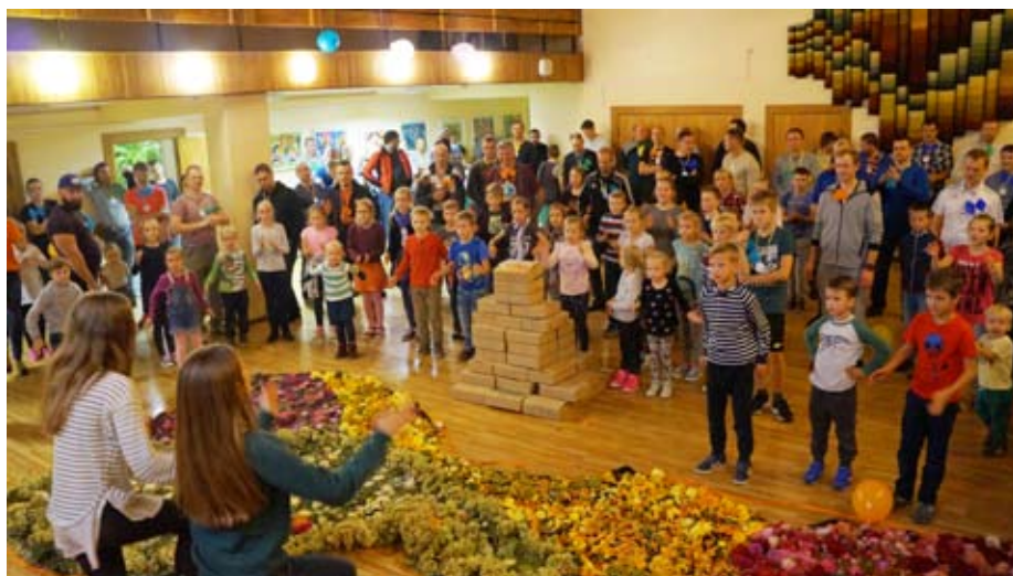
Tēvu veidotais draudzības tornis – piramīda un fināla dejas.

Mācību gada sākumā 1.-4.klašu tēti, vectēvi saņēma ielūgumus. Svētku vakarā katrs ielūgtais viesis saņēma krāsainu piešpraudī – taurenīti, kuru pasākuma laikā bija jāizrotā ar uzlīmēm, kuras apliecināja tēva un bērna kopīgo piedalīšanos un darbošanos radošajās stacijās. Svētki sākās ar kopīgu iesildīšanos – Olimpiskās dienas vingrojuma kompleksa izpildīšanu kopā ar 10.klases meitenēm. Tad katrs tētis saņēma dārgumu lādi, kuru papildināja ar pārsteigumiem, apmeklējot 5 dažādas stacijas – “Kāds ir mans tētis? Tēta labie darbi”, “Tētis virtuvē”, “Tētis pie spoguļa”, “Tētis metējs” un “Tētis sporto.”