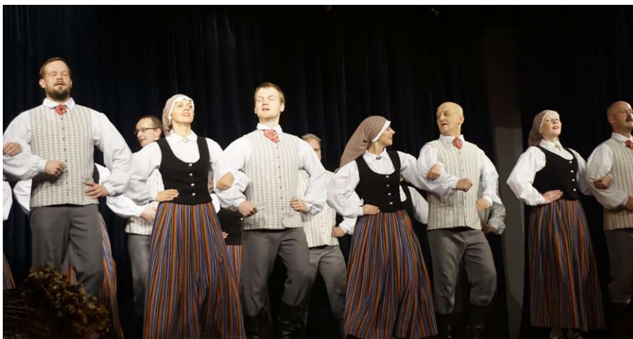
Krimuldas Tautas nama VPKD “Dzirnakmeņi”.