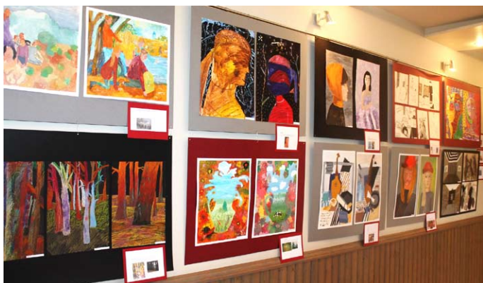
Krimuldas mūzikas un mākslas skolas Vizuāli plastiskās nodaļas audzēkņu izstāde Krimuldas Tautas namā.

Izstāde apskatāma līdz 27. novembrim darba dienās no pl. 8.30 līdz 17.00 (piektdienās līdz 16.00). Ieeja brīva.