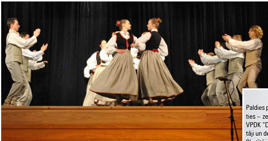
Lēdurgas kultūras nama JDK “Metieniņš”.