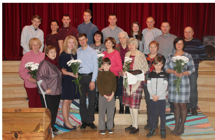
Novada daudzskaitlīgā Kaņeņu dzimta sazarojās Zebuliņu, Antonovu, Kalniņu, Lūsaru un vēl citās ģimenēs