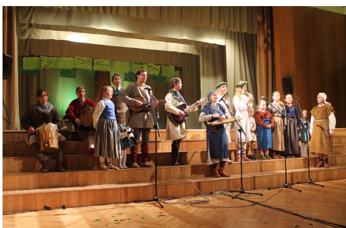
Lēdurgas KN folkloras kopa “Putni” svētku pasākumā