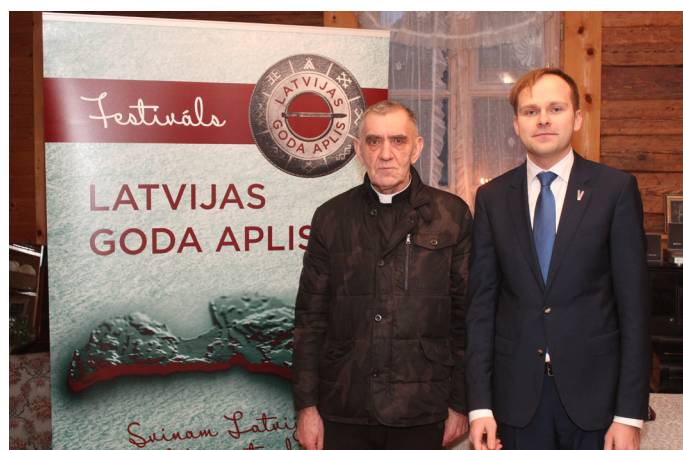
Festivālu “Latvijas Goda aplis” pirmais uzņēmējs Krimuldas novads