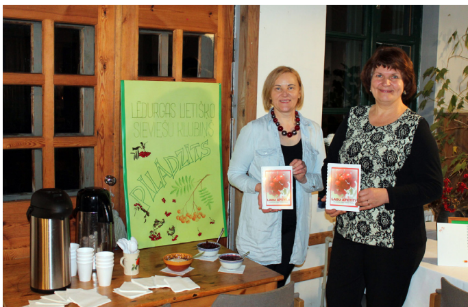
Lietiško sieviešu klubīņa “Pīlādžītis” pārstāves prezentē pašu sagatavoto pavārgrāmatu