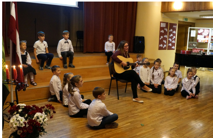
Krimuldas vidusskolā koncerts par godu Latvijas 99.dzimšanas dienai.