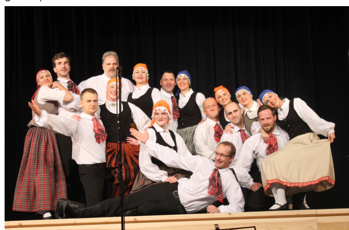
Krimuldas TN VPK “Dzirnakmeņi” svētku pasākumā