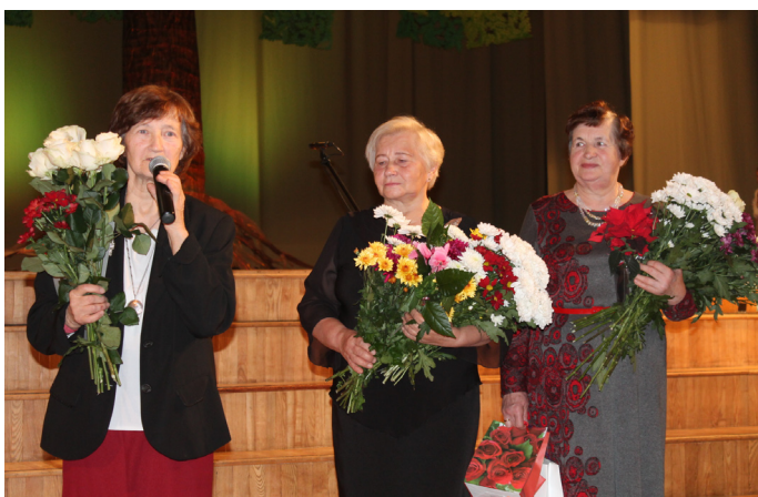
Lēdurgas biedrības “Kamolītis” valdes pārstāves pateicās pēc apsveikuma saņemšanas