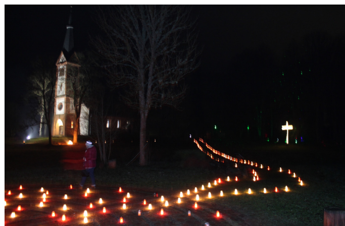
Krimuldas baznīcas apkārtnē vakarā ieguva pasakainu tēlu ar svecītēm un no Aušu parka (Baldones novads) atvestajām košajām, krāsainajām gaismiņām