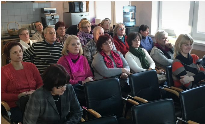
EKO laukumu pārziņu mācības

13.decembrī Reģionālajā atkritumu apsaimniekošanas centrā "Daibe" notika ikgadējās SIA ZAAO (ZAAO) EKO laukumu pārziņu mācības, lai papildinātu darbinieku kompetences ikdienas darbu veikšanai un teicamai klientu apkalpošanai.