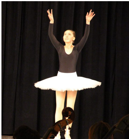
Klasiskās dejas solo

13. janvārī Krimuldas Tautas namā skatītājus un klausītājus ar saviem jauniestudējumiem un jau labi zināmajiem uzvedumiem iepazīstināja Krimuldas Mūzikas un mākslas skolas deju nodaļas audzēkņi un Krimuldas un Limbažu jauniešu simfoniskais orķestris. Koncerts bija kā smalki iestudēta izrāde trīs cēlienos jeb trīs dažādos deju ritmos – klasiskā, tautiskā un modernā.