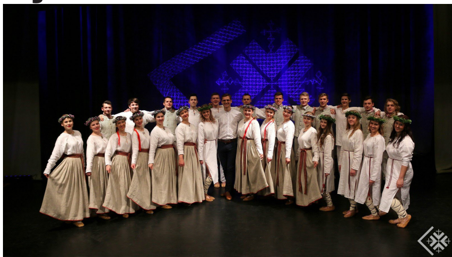
Katrs no mums "Metieniņu" var saukt par savu otro ģimeni!

un, neapšaubāmi, tas arī mums pašiem radīja prieku un gandarījumu, jo dejojot nav nekā labāka par skatītāju vērtējumu un apziņu, ka viņiem tiešām patika. Vēl no mūsu repertuāra skatītājiem rādījām mūsu vidū iemīļoto deju "Pazarītes" un arī šīs sezonas jaunumu "Pa zaru zariem". Arī šīs dejas guva skatītāju atzinību un varējām būt lepni par padarīto.