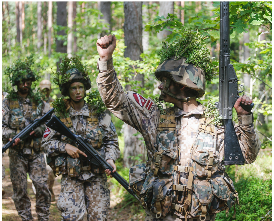
Zemessardze dod iespēju pilsoņiem brīvprātīgi kalpot savai valstij, rūpējoties par tās drošību un aizsardzību

Dienests Zemessardzē ļauj izmantot civilajā dzīvē gūto profesionālo pieredzi, tāpēc līdzdarboties valsts aizsardzības spēju stiprināšanā aicinām visdažādāko profesiju pārstāvjus: IT speciālistus, pavārus, autovadītājus, mediķus, pedagogus, sistēmu