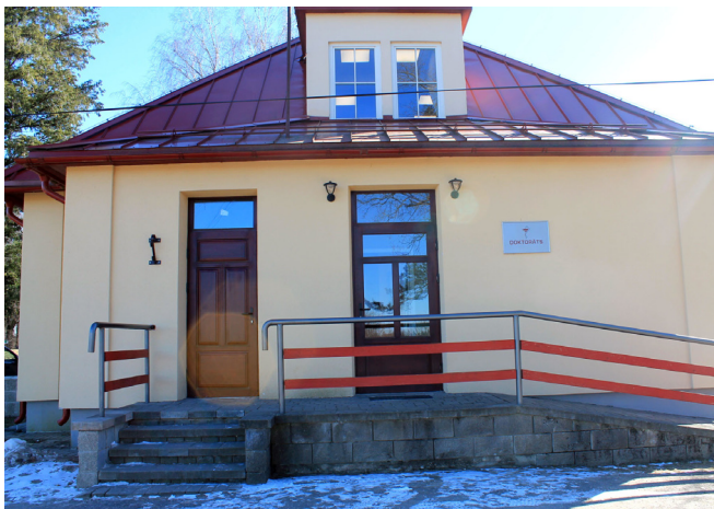
Krimuldas novada būvvaldē var nokļūt pa durvīm (kreisajā pusē), kas atrodas blakus Doktorāta ieejai. Būvvaldes atrašanās norāde vēl top un tiks uzstādīta

Šogad esam pieņēmuši ekspluatācijā divus skaistus objektus. Viens no tiem ir objekts, kurš ilgstoši bija atradies novada graustu sarakstā, tagad ir sakārtots. “Žogulošs” Krimuldas pag., Krimuldas nov. veikta divu angāru pārbūve par kūdras fasēšanas uzņēmumu. Turaidas muzejrezervātā ir pabeigta un pieņemta ekspluatācijā Klaušinieku māja. Ēka ir uzbūvēta no jauna, autentiska vēsturiskajai Turaidas muižas Klaušinieku mājai, pielietojot senās būvniecības metodes, materiālus, saglabājot vēsturisko plānojumu.