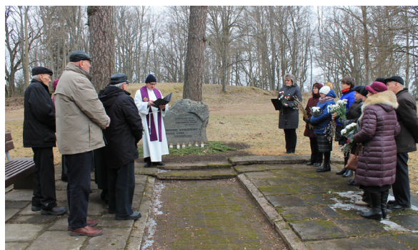
25. martā pie represēto piemiņas akmens Lēdurgā

Ir 25. marts un Lēdurgas pie piemiņas akmens represētajiem pulcējas novadnieki, kuriem ar šiem notikumiem saistās kāds dzimtas stāsts vai paša pārdzīvojumi. 1989. gada 30. jūlijā šis laukakmens piemineklis tika uzstādīts un atklāts, iesvētīts sarkanbaltsarkanais karogs. Kopš tā laika ik gadu šeit pulcējas cilvēki, godinot tā laika skarbos notikumus, kas uz visiem laikiem ir atstājuši zīmes palicējos. Atmiņas iemūžinātas arī dokumentālā un mākslas kino: "Veļu upe", "Melānijas hronika", "Via Dolorosa", "Gulaga stāsti" runā ar mums. Tikai mūsu ziņā ir kā tos stāstus uztveram.