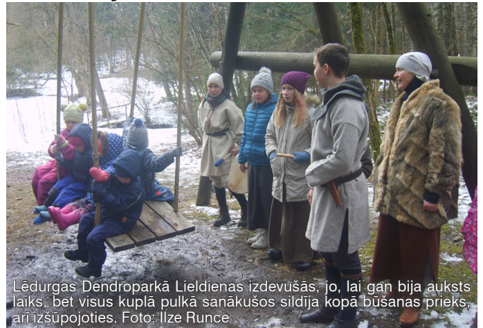
Lēdurgas Dendroparkā Lieldienu izdevušās, jo, lai gan bija auksts laiks, bet visus kuplā pulkā sanākušos sildīja kopā būšanas prieks, arī izšūpojoties.

Uz tikšanās Lēdurgas Dendroparkā, jo tuvojas magnoliju ziedēšanas laiks!