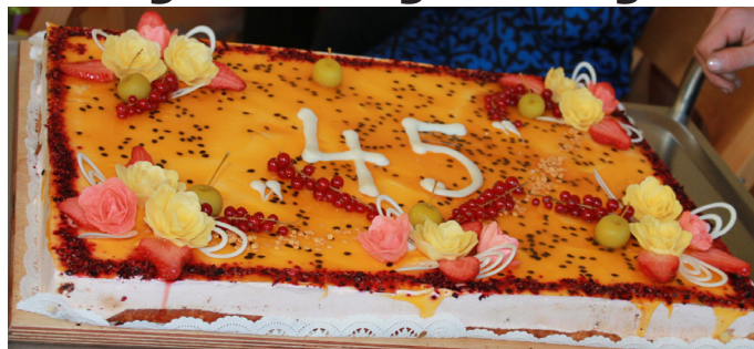
PII "Krimulda" jubilejas kūka

PII "Krimulda" darbu sāka 1973. gada pavasarī, kad pirmoreiz bērnudārza durvis mazajiem ķipariem vēra skolotājas un citi svarīgi