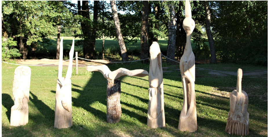
Lēdurgas Dendroloģiskais parks būs vieta, kur tiks izvietotas izveidotās putnu skulptūras

Paldies atsaucīgajiem lēdurdziešiem Evi-