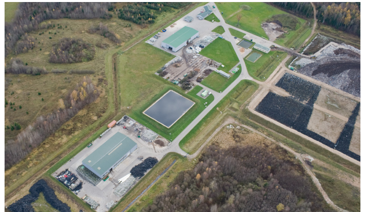
Poligons "Daibe" no putna lidojuma

Saskaņā ar SPRK pieņemto lēmumu, ZAAO sadzīves atkritumu apglabāšanas pakalpojuma tarifs par vienu noglabāto atkritumu tonnu, ieskaitot dabas resursu nodokli, bet bez pievienotās vērtības nodokļa, līdz šā gada beigām palielināsies par 19,2% un būs 48,55 eiro par tonnu. Savukārt nākamā gada sākumā tarifu paredzēts pacelt vēl par 7,6%, tam pieaugot līdz 52,53 eiro par tonnu, bet 2020. gadā to paredzēts palielināt vēl par 6,6%, tam sasniedzot 56,02 eiro par tonnu līdz jauna tarifa spēkā stāšanās brīdim. Jā-