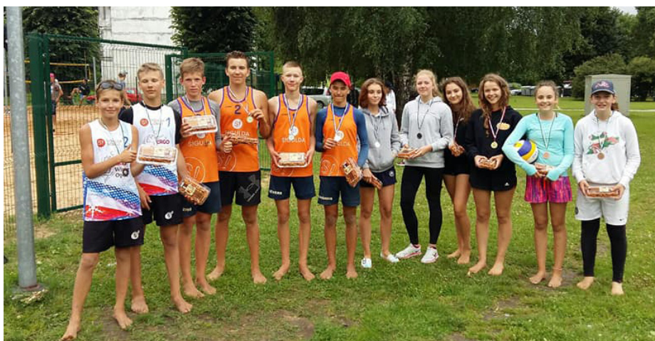
Uzvarēt vienmēr ir patīkami!

Sacensībās pieteicās 32 komandas - 13 jauniešu komandas, 6 sieviešu un 13 vīriešu komandas. Pludmales volejbola laukumi piedzīvoja sīvas un aizraujošas cīņas.