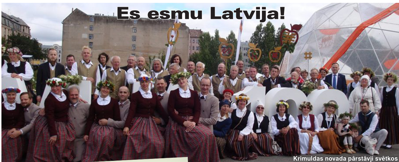
Krimuldas novada pārstāvji svētkos