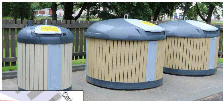
Atkritumu konteineri Cēsīs.

Modernizējot atkritumu apsaimniekošanu, Raganā plānots izbūvēt pazemes atkritumu konteinerus, sakārtojot apkārtnējo vidi un padarot to vizuāli pievilcīgāku. Viens pazemes atkritumu šķirošanas konteiners aizvieto piecus metāla konteinerus, turklāt tikai 1/3 no konteina atrodas virszemē un tie ir vizuāli pievilcīgāki un ērtāki lietošanai. Vēssais mikroklimats samazina nepatīkamu smaku veidošanos. Pazemes konteineru laukumu izveide palīdz arī samazināt iekšpagalmu ceļu noslodzi, jo nepieciešams veikt retāku konteineru tukšošanu, tā ir arī iespēja atbrīvot teritoriju iedzīvotāju automašīnu stāvlaukumiem.