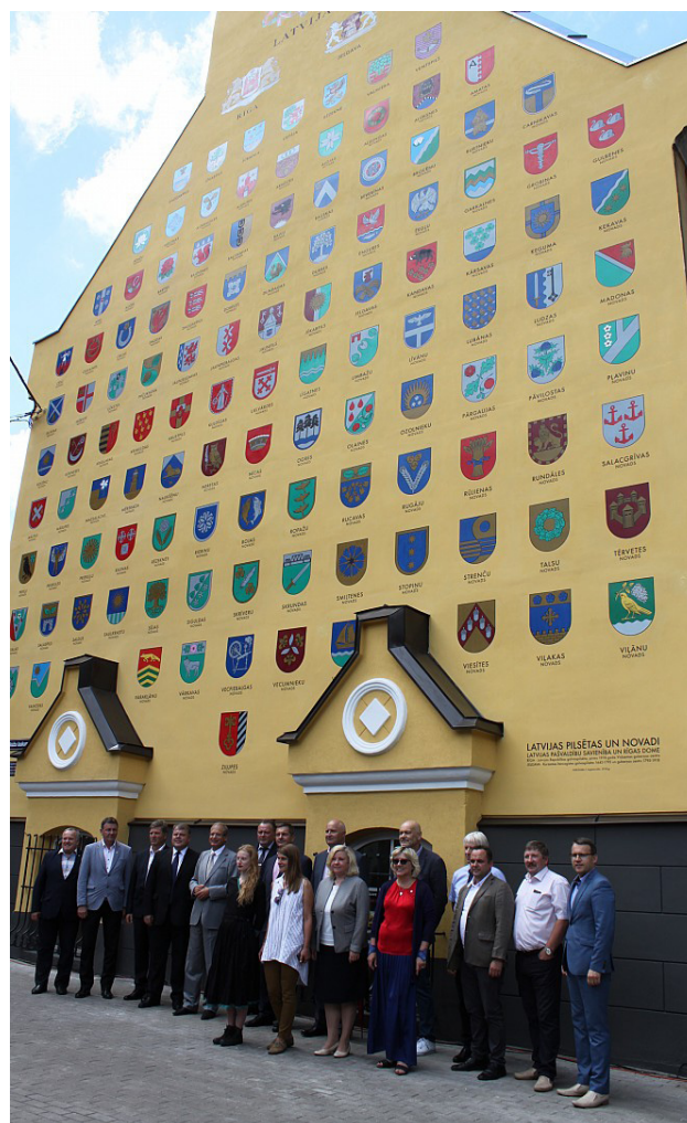
Notiek sienas apgleznošana un sagatavošana svinīgajai atklāšanai.

Latvijas Pašvaldību savienības Komunikācijas nodaļas vadītāja, padomniece sabiedrisko attiecību jautājumos