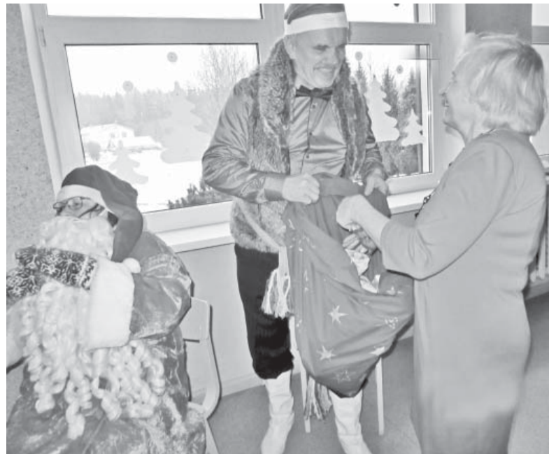
Ziemassvētku vecītis katram svētku svinētājam bija sarūpējis dāvanīņu!

Negaidīts pārsteigums bija Ziemassvētku vecīša ierašanās, kurš aicināja tāpat kā bērniņā nākt pie eglītes un izsacīt savu vēlējumu svētkos. Kapelas „Aizezeres muzikanti” spēloto melodiju pavadījumā, kā jaunībā raisījās dejas solis, un laiks pagāja liksmā svētku noskaņā.