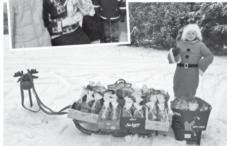
„Riekstiņciema rūķi” dāvanas briedītis jau aizvīnājis pie to saņēmējiem!