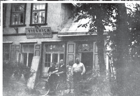
Laubes krogs „Puķudrūvās” 20.gs. 30. gados. Arī šodien senā ēka mūs sagaida Vērenes ielā.

bes tas notika kulturāli, nepiedienīgu uzvešanos tur nepieļāva. Kas, pavairāk ietinnājās, grāsijās aizmigt pie galdiņa apmeklētāju zālē vai pacēla balsi, to krodziniēks klusiņām izvadīja laukā, lai nekļūst par piedauzību citiem viesiem. Pārdzēršanās, ķildas un kautiņi izslēgti, šādas temperamenta izpausmes koknesiešiem nebija raksturīgas.