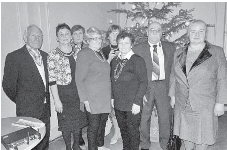
Kokneses novada represēto nodaļas biedri Rīgas Latviešu biedrības namā.