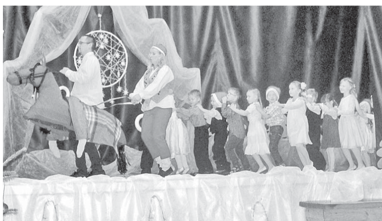
Katrai klasei bija iespēja parādīt savu radošumu, gatavojot priekšnesumu.