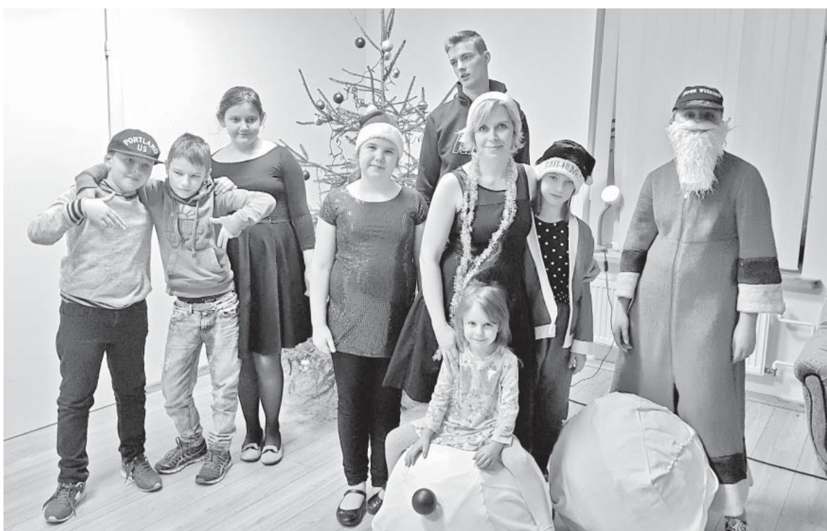
Jaunais gads mūsu centrā iesākās ar Popielu!

Ievērojot tradīcijas, tiek rīkoti divi vasaras brīvlaika koncerti – pirmais vasaras brīvlaikam sākoties, 1.jūnijā – Bērnu starptautiskās aizsardzības dienā „Sveika vasara, ardievas skolai”, otrais vasaras brīvlaikam beidzoties, 30.augustā, „Ardievas vasarai, sveika