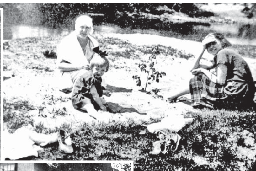
1928. gada pirmajās dienās pie Pērses.

Laubes krogs, saprotams, pievilka arī alkoholiķus, arī tiem nepieciešama vieta, kur uzturēt sadraudzību. Pie Lau-