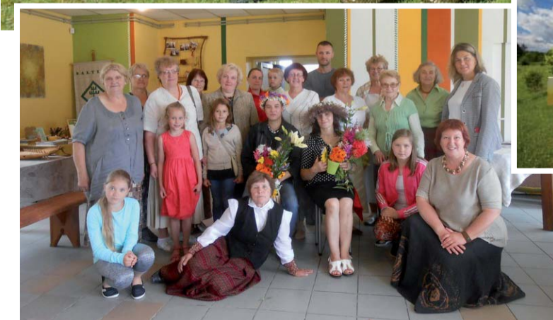
Radošās mājas darbīgie ļaudis.

Pie mums vienmēr raibi, vienmēr labi! Un “radošums” ir atslēgas vārds katram, kas labprāt ir kopā ar mums! Uz tikšanās!