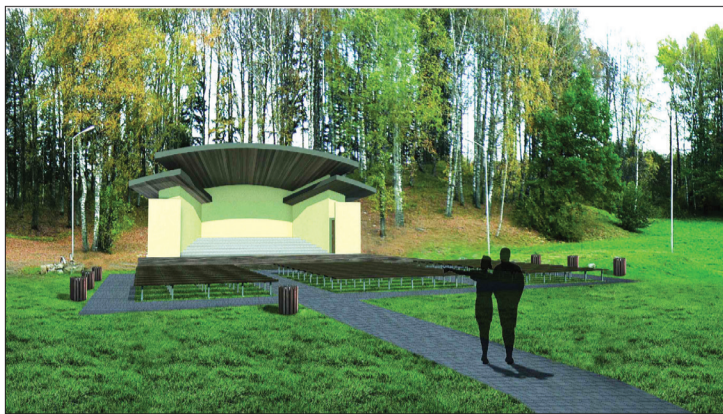
Dupurkalna estrādes vizualizācija