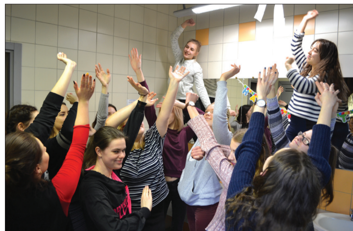
Kadrs no filmas „Vai varu, lūdzu, iziet?”