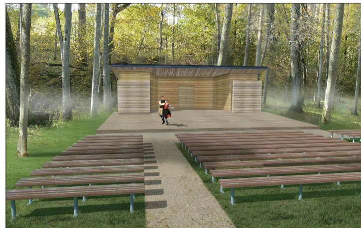
Tiņģeres estrādes vizualizācija

„Dupurkalna brīvdabas estrāde ir kultūrvēsturisks objekts. Valdemārpilī šī estrāde bija gan morāli, gan fiziski novecojusi, so-