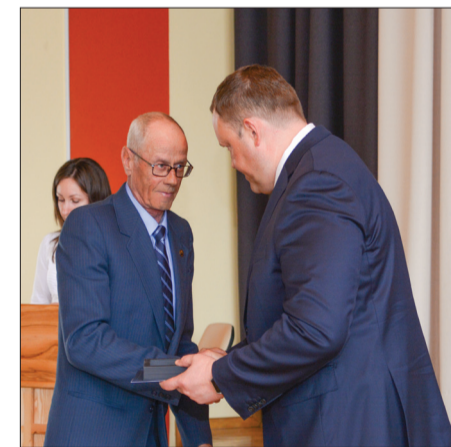
Piemiņas zīmes Černobiļas avārijas seku likvidēšanas vīriem pasniedza iekšlietu ministrs Rihards Kozlovskis