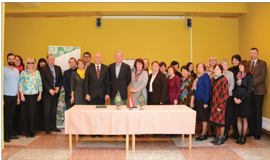
Svinīgajā līguma parakstīšanas brīdī klāt bija arī Talsu Galvenās bibliotēkas darbinieki, kā arī pārstāvji no Talsu bērnu bibliotēkas un Bērnu un jauniešu centra

Šobrīd vēl turpinās objekta projektēšana, bet būvniecību paredzēts sākt pēc aptuveni pieciem mēnešiem. Jaunās mājas Talsu Galvenās bibliotēka varētu apdzīvot jau Latvijas simtgades laikā.