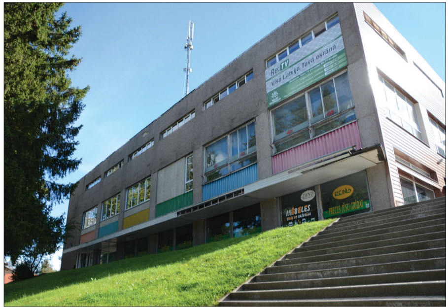
Talsu Galvenās bibliotēka Brīvības ielā 17a