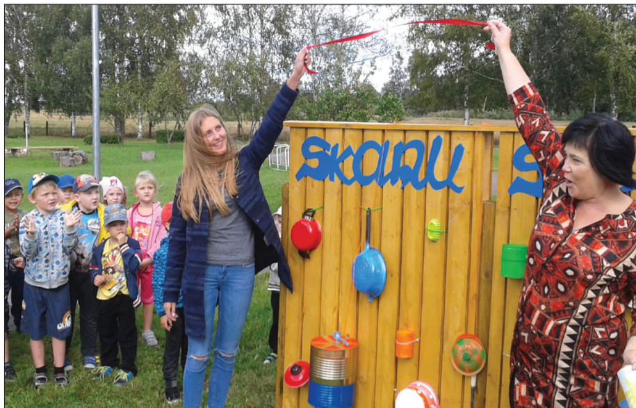
Aizvadītā gada Rūtas Amsteres projekta „Skanošā siena” atklāšanas pasākums – jauniešu dāvana bērnu dārzam.

Jau kopš 2014. gada Talsu novada pašvaldība piešķir finansējumu novada Bērnu un jauniešu centra rīkotajam jauniešu iniciatīvu projektu konkursam. Šogad tiks īstenoti septiņi projekti par teju 3000 eiro. Jauniešu idejas ir daudzveidīgas – no ugunsкура vietas iekārtošanas līdz pat draudzības maisa radīšanai.