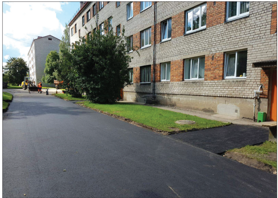
Aizvadītā gada projektu konkursā A. Pumpura ielas 10 iedzīvotāji ar pašvaldības līdzfinansējumu mājas pagalmā uzklāja jaunu asfaltbetona segumu

Talsu novada domes deputāti Tautsaimniecības komitejā puda atbalstu iecerei par papildu finansējuma novirzīšanu projektu konkursam. Šādas aktivitātes veicina ne tikai apkārtējās vides sakārtošanu, bet arī vairo iedzīvotāju izpratni par savu lomu mājas sakārtošanā, mudina pašiem būt aktīviem un realizēt vēlmes.