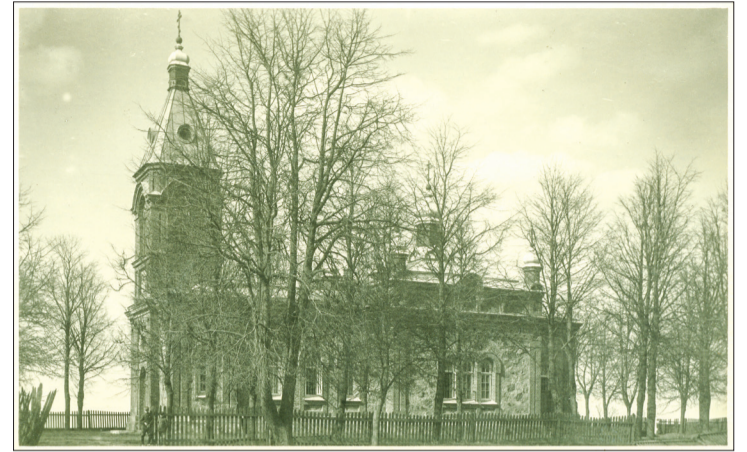
Talsu pareizticīgo baznīca 20. gadsimta 20.–30. gados

„Šajā teritorijā 1889. gadā tika uzcelta pareizticīgo baznīca, kļēru māja un draudzes skola. 1891. gadā Talsu draudzē bija 936 cilvēki, taču Pirmā pasaules kara laikā draudze darbību pārtrauca un baznīca tika izmantota, lai uzglabātu kartupeļus un labību. Beidzoties Pirmajam pasaules karam, draudze atsāka darbību. Pareizticīgo baznīca tika uzspriecināta 1972. gadā, veidojot rajona un pilsētas administratīvo centru,” ieskatu vēsturē sniedz Talsu novada muzeja galvenā