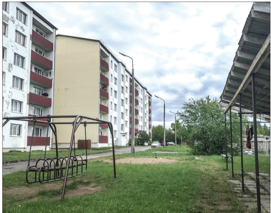
Arī Celtnieku ielas iedzīvotāji vēlas patīkamas pārmaiņas savā pagalmā