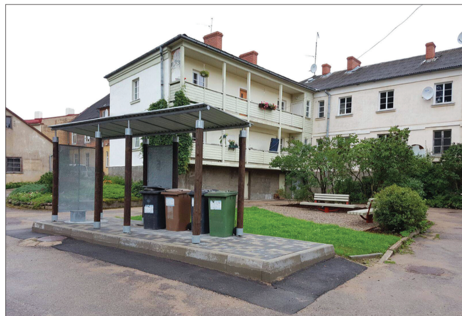
Lielās ielas 29 un 29b iedzīvotāji pagalmu labiekārtošanas konkursā ir piedalījušies jau divus gadus, sakārtojot atkritumu konteineru laukumus un nobruģējot daļu no pagalma, kā arī iesējot zāli un iestādot tūjas

Interesi par dalību projektu konkursā izrādīja vairāku dzīvojamo māju iedzīvotāji arī pagastu teritorijās, bet lielākais šķērslis ieceres realizēšanai ir nespēja mājas iedzīvotājiem vienoties savā starpā.