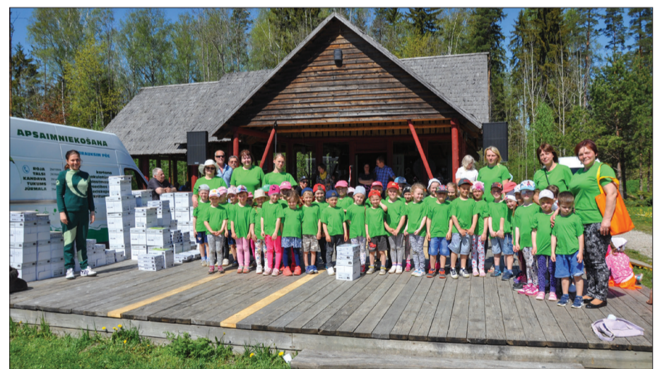
Laidzes PII „Pārdāte” audzēkņi savākuši 5500 kg makulatūras, tā izglābjot 77 kokus

SIA „Atkritumu apsaimniekošanas sabiedrība „Piejūra”” sabiedrisko attiecību speciāliste