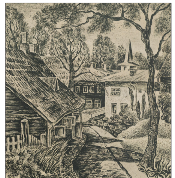
Rūtas Opmanes darbs