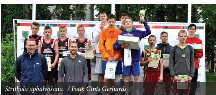
Strībola apbalvošana