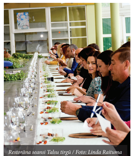
Restorāna seansi Talsu tirgū