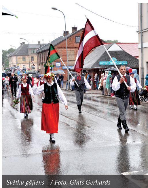
Svētku gājiens