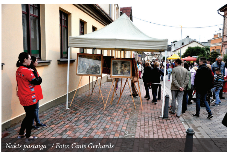
Nakts pastaiga