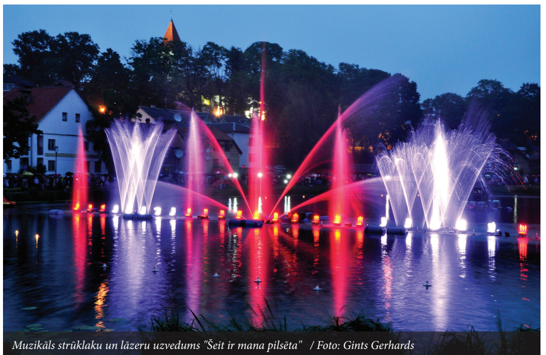
Muzikāls strūklaku un lāzeru uzvedums „Šeit ir mana pilsēta”