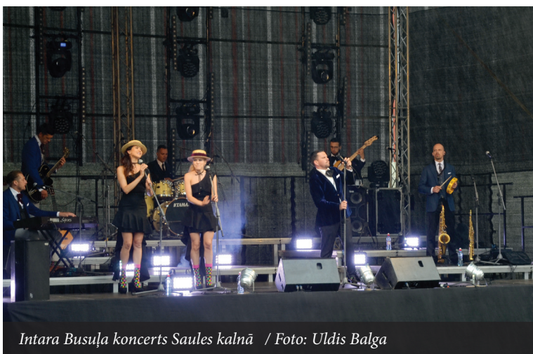
Intara Busuļa koncerts Saules kalnā