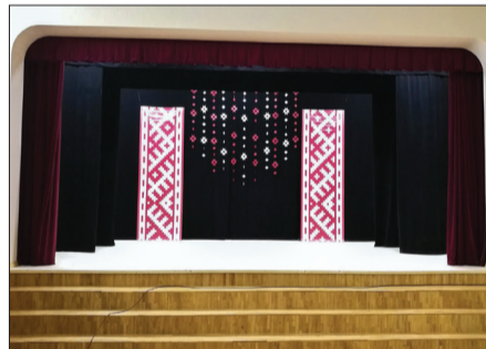
Laucienes kultūras namā sakārtota skatuves daļa.

Laucienes kultūras namā turpinās atjaunošanas darbi un iesākts lielās zāles skatuves daļa, iegādāts jauns skatuves priekšsargs un apgaismojuma iekārta. Šķēdē izbūvēta dzeramā ūdens atdzelžošanas iekārta. Laucienes centrā pie daudzdzīvokļu mājas „Gatves” ierīkots jauns bērnu rotaļu laukums. Pūckalna un Tuņņu kapos uzstādīti jauni kapu vārti. Uzlabots Laucienes ciema ielu apgaismojums. Turpinās Laucienes sporta centra Pļavu ezermalas sporta bāzes labiekārtošana – tajā ierīkota videonovērošana ar četrām kamerām. Iesniegts projekts Laucienes centra skvēra labiekārtošanai LEADER programmā.