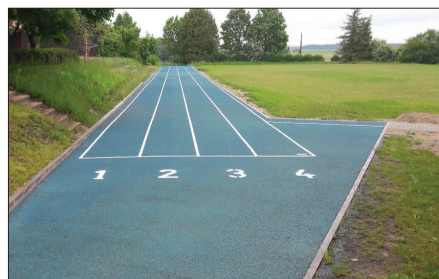
Pie Balgales sporta centra izveidots skrejceļš.

Bērnu dārzā pārcelts uz skolas telpām, izveidots sanitārais mezgls un apkures sistēma. Dursupes pamatskolā veikti virtuves bloka remontdarbi. Labiekārtota Dursupes ezera apkārtnē un sakārtota peldvieta. Veikts kosmētiskais remonts pagasta pārvaldes ēkā, sociālā dienesta kabinetā, kā arī pārvaldes ēkā „Grantiņi”. Labiekārtota piemiņas vieta Dursupē. Izremontētas bijušā bērnu dārzā telpas. Pie Balgales sporta centra izbūvēts skrejceļš.