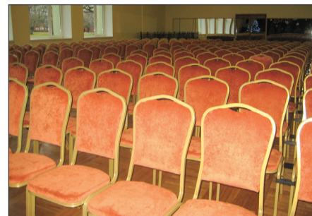
Pastendes kultūras nama zāle papildināta ar jauniem skatītāju krēsliem.

Veikti vairāki uzlabojumi Pastendes kultūras namā: atjaunota iekšējā ugunsdzēsības sistēma, atjaunoti divi jumti, iegādāti skatītāju krēsli. Izremontēta Pastendes pamatskolas ēdamzāle. Bērnu dārzā „Ķipars” ierīkota zibens aizsardzības sistēma un izremontēta grupas telpa. Pastendes bērnu laukumā izveidoti apstādījumi. Pastendes bibliotēkā veikta elektroinstalācijas nomaņa. Spāres tautas namam iegādāti skatītāju krēsli. Atjaunota grants ceļa „Gravas – Ģibuļu skola” virsma. Gaviļnieku kapos atjaunots žogs. Vairāki darbi paveikti Spāres muižā: parkā izvietoti tiltiņi un informācijas stends, atjaunotas novadpētniecības ekspozīcijas telpas un uzsākti teritorijas labiekārtošanas darbi – ielu apgaismojuma uzstādīšana un auto stāvvietas sakārtošana.