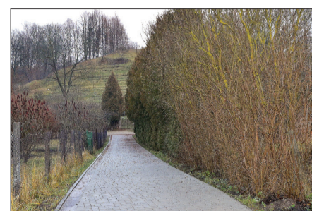
Uz Vīna kalnu ved šogad nobruģētā ietve.

Uzstādītas ūdens atdzelžošanas iekārtas ŪAS „Briņķi”. Talsu ielā veikts gājēju ietves remonts, kā arī apgaismojuma remontdarbi. Izveidotas jaunas elektrības