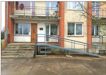
Pie ģimenes ārsta prakses uzstādīta uzbrauktuve.