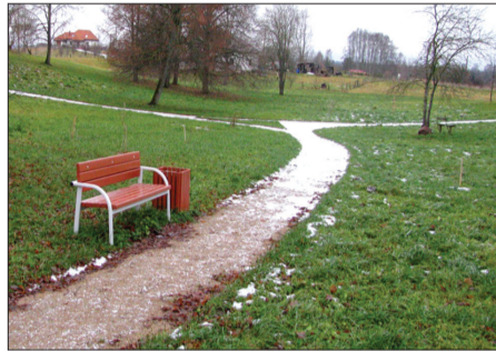
Labiekārtojot daudzdzīvokļu māju teritorijas, uzstādīti jauni soliņi un atkritumu urnas.

Lībagu sākumskolā veikts sanitārā mezgla remonts un nomainītas plīts virsmas. Labiekārtota teritorija pie daudzdzīvokļu mājām Mundigciemā. Sakopta teritorija pašvaldības īpašumā „Angārs” Mundigciemā. No Sukturu kapiem savākti un izvesti atkritumi. „Skolas ceļā” Dižstendē izbūvēts ielu apgaismojums. Lībagu bibliotēkā izbūvētas elektroinstalācijas. Paplašināti Bungu kapi – izbūvēti celiņi, ierīkota ūdens ņemšanas vieta, nodrošināts elektrības pieslēgums, sakārtots pievedceļš un izstrādāts būvprojekts kaplicai.