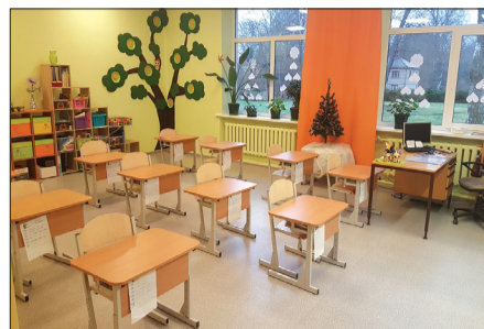
Dzīvespriecīgās krāsās izremontētā klase Stendes pamatskolā.

Stendes pamatskolā veikts mūzikas klases kosmētiskais remonts, bet skolas jumtam izveidota zibens aizsardzības sistēma. Bērnudārzā „Saulīte” veikts sanitārā mezgla kosmētiskais remonts. Tautas namā nomainīti kulises aizkari un sofites. Tapusi krāšņa dāvana Latvijas simtgadei – rododendru parks, kurā ierīkotas taciņas, novietoti soliņi un atkritumu urnas, iestādīti 150 rododendru stādi, kā arī uzstādītas