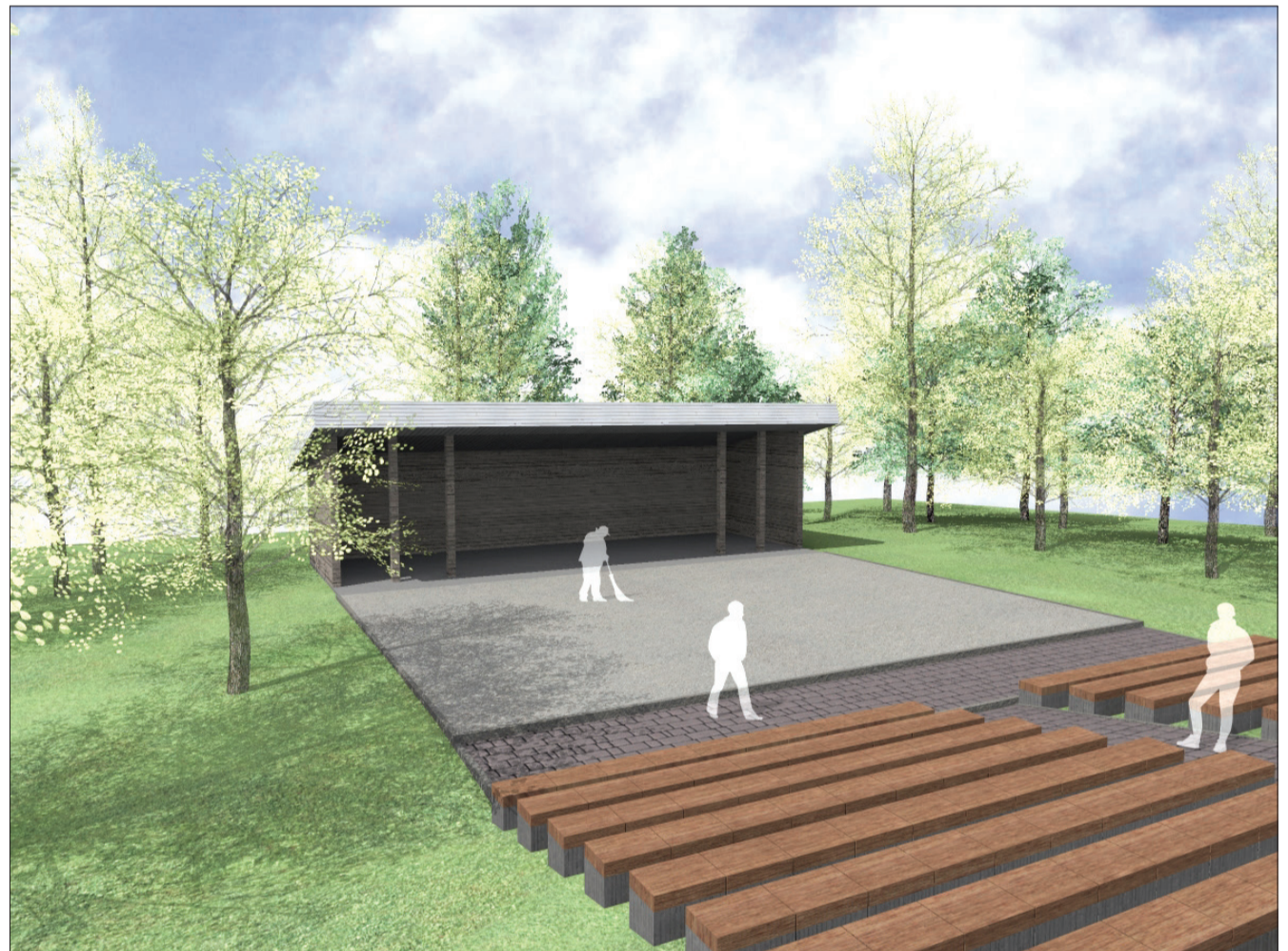
Tiņģeres brīvdabas estrādes vizualizācija.

Uzsākot jauno gadu, turpinās aktīvs darbs pie projektu īstenošanas: apstiprināts projekts „Vispārējās izglītības iestāžu mācību vides uzlabošana Talsu novadā”, atbalstu guvis projekts, kas paredz revitalizēt industriālo teritoriju Celtnieku ielas rajonā Talsos, kā arī projekts, kā ietvaros notiks Raiņa ielas pārbūve Talsos. Jau pavisam tuvā nākotnē pie jaunas brīvdabas estrādes tiks Tiņģeres iedzīvotāji – noslēdzies iepirkums par būvdarbu veikšanu. Aizvien aktuāla ir Talsu Galvenās bibliotēkas, Talsu tirgus un Dupurkalna estrādes būvniecība. Vairākos gadījumos konstatēts būtisks sadārdzinājums, tāpēc projektos nepieciešams veikt izmaiņas, lai rezultāts būtu saprātīgs un pārdomāts.