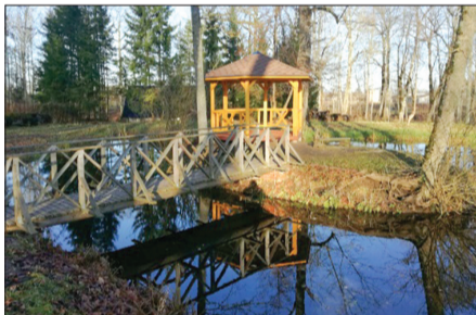
„Mīlestības salīņas” lapene.

Rekonstruētas Tiņģeres pils jumta notekas, kā arī tualetes un koridors pie pils kapelas. „Mīlestības salīņā” izveidota lapene, bet, lai nokļūtu līdz salīņai un avotam, ierīkots gājēju celiņš. Parkā sakārtota elektroapgāde, bet bērnu dārzā „Saulstariņš” Tiņģeres filiālē nomainīts skurstenis.