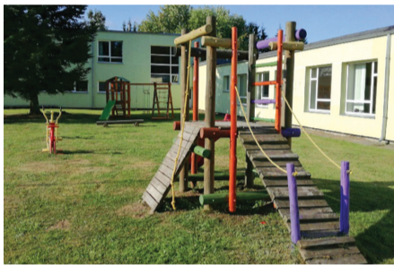
Pilnveidotais bērnu rotaļu laukums.

Pilnveidots un labiekārtots bērnu rotaļu laukums. Brīvā laika pavadīšanas centram iegādātas jaunas logu žalūzijas. Veikts pagasta pārvaldes katlumājas skursteņa remonts, kā arī pagasta pārvaldes ēkas pagrabstāva telpu kosmētiskais remonts. Labiekārtoti Lubes kapi.