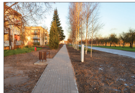
Gājēju celiņš Pūņās.

Pūņu pamatskolā atjaunota daļa elektroinstalācijas, pie skolas izveidots un aprīkots āra trenāžieru laukums, skolas sporta zālē novērš akustikas problēmas, kā arī izstrādāts un apstiprināts LAD projekts par zīmju takas izveidi skolas teritorijā. Savukārt bērnu dārzā veikts daļējs ēkas jumta remonts, kā arī izremontētas grupiņu telpas. Pūņās izbūvēts gājēju celiņš. Tautas nama lielajā zālē atjaunota grīdas virsma. Pagasta centrā uzstādīti atpūtas soliņi un veikts ielu apgaismojuma remonts. Izgatavots pagasta karogs un pacelts mastā pie „Pagastmājas”. Darināti 20 sieviešu svārkis tautas nama diviem pašdarbības kolektīviem. Veikti pagasta autoceļu remontdarbi. Turpinās bišu ceha grausta un „Ābelišu kūtis” teritorijas sakārtošana.