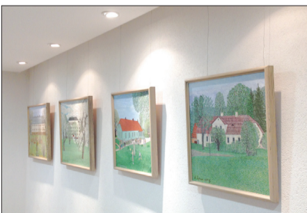
Fragments no Modra Sapuna darbu izstādes.

Bērnu dārzam „Paparđite” iegādātas zāles logu žalūzijas un inventārs vienai grupai. Talsu 2. vidusskolas filiāles Laidzes pamatskolai iegādāta skaņu aparatūra, atjaunotas divas krāsnis, informātikas kabinets un zāles griesti. Atjaunota meliorācijas sistēma teritorijas nosusināšanai pašvaldības nekustamajā īpašumā „Centrs”. Uzstādītas pagasta ielu un māju norādes. Zvirgzdos trotuāriem virzienā no autobusu pieturas uz dzīvojamām mājām un veikalu „Top!” nomainīts segums. Iegādātas un uzstādītas koka šūpoles. Uzstādītas trīs suņu ekskrementu savākšanas urnas un iegādāta bio tualete. Atjaunots pašvaldības autoceļš Nr. 29 „Kopmītne – Matre” un tam pieguļošā laukuma segums. Apskates objektā „Stihiju aleja” izveidots centrālais gājēju celiņš un labirints „Taurenis”. Sakārtota Rocežu kapiem pieguļošā teritorija un veikti koku vainagu sakopšanas darbi, savukārt Nodenu kapos atjaunotas akas koka konstrukcijas. Papildus prioritārajiem darbiem realizēti Talsu novada kultūras un tūrisma projekta finansēšanas konkursa projekti – „Opermūzikas svētki Laidzē” un „Laidzes mūzikas atspulgs Modra Sapuna gleznās”.