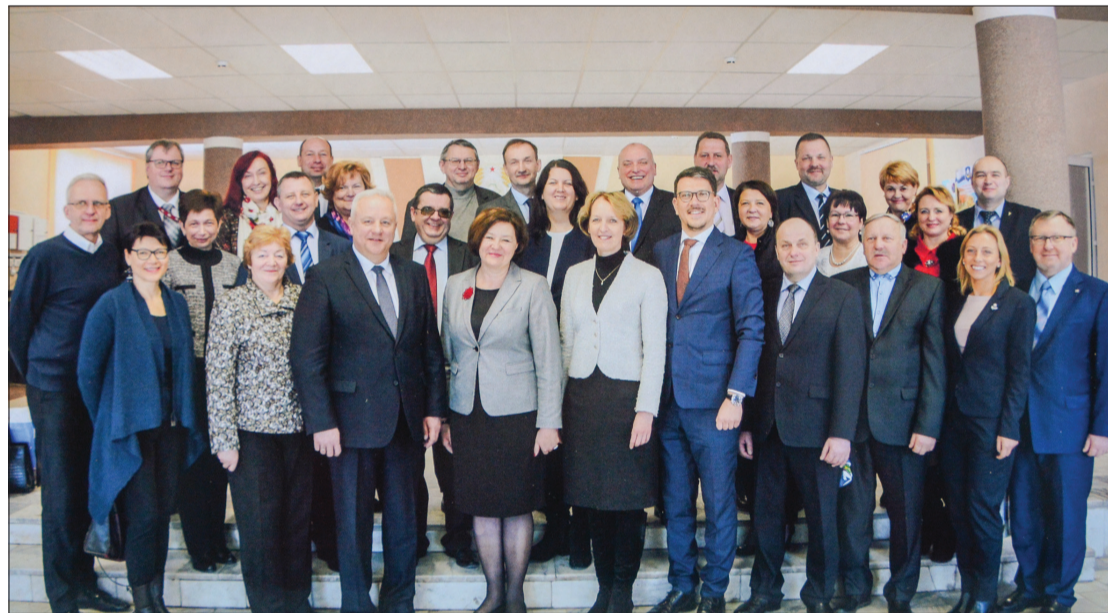
16 Kurzemes pašvaldību vadītāji vizītē Oršas rajonā Baltkrievijā

Vizītes ietvaros Latvijas deleģācijai bija iespēja apmeklēt arī Vitebskas pilsētas izpildkomiteju. Vitebskā dzīvo 77 tūkstoši iedzīvotāju, kas iedzīvotāju skaita