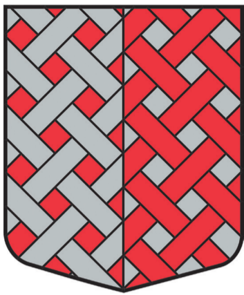
Virbu pagasta ģerbonis

Vēl viens Talsu novada pagasts ticis pie sava ģerboņa – 14. jūnijā Kultūras ministrija reģistrējusi Virbu pagasta ģerboni.