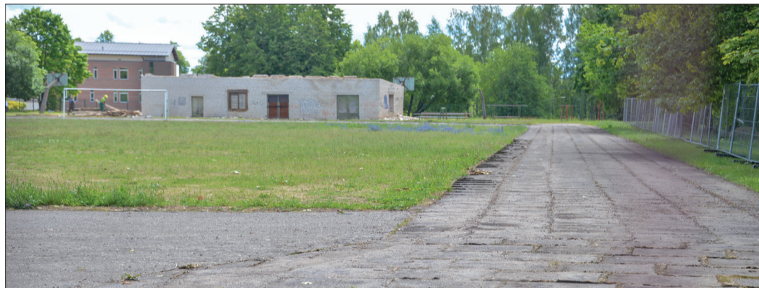
Šobrīd stadionā notiek sagatavošanās darbi tā pārbūvei

Pagājušajā nedēļā uzsāks viens no šīs sezonas vērienīgākajiem darbiem Talsu pilsētā – Talsu Valsts ģimnāzijas stadiona pārbūve. Jau šogad Talsu Valsts ģimnāzijas un Talsu sākumskolas audzēkņiem tiks radīta mūsdienīga āra sporta infrastruktūra – futbola laukums ar mākslīgo segumu, tāllēkšanas, augstlēkšanas un lodes grūšanas sektori, basketbola laukums un skrejceļi, kā arī rotaļu laukums, kur sākumskolas bērniem aktīvi pavadīt stundu starpbrīžus.