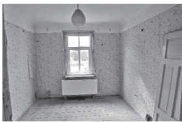
Neapgūtās telpas muzeja 2. stāvā šobrīd

nesta Viduslatvijas reģionālās lauksaimniecības pārvaldes lēmumu, ar kuru apstiprināts projekts Nr. 18-05-AL24-A019.2204-000005 "Sēlijas prasmju muzeja" attīstība Sēlijas kultūrvēsturiskā mantojuma