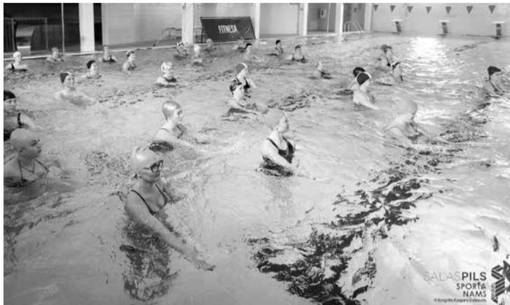
Ūdens aerobika ir teju vai universāls sporta veids, kas piemērots visiem. Par to pārliecinājās “Fitnesa deserta” dalībnieces.

Lāčplēša dienas rītā, kad daudzi gatavojās tradicionālajam lāpu gājienam, īpaša rosība notika sporta nama hallē un peldbaseinā. Šeit pulcējās sportiskie un aktīvie, lai piedalītos “Fitnesa desertā”. Tas ir pasākums, kura laikā ikviens var iepazīties ar plašo nodarbību klāstu, ko piedāvā ik dienas sporta nama treneri. Cik treniņus apmeklēt dienas laikā – atkarīgs no katra paša. Pavisam tika piedāvātas veselas 25 nodarbības, no kurām varēja izvēlēties sev piemērotākās.