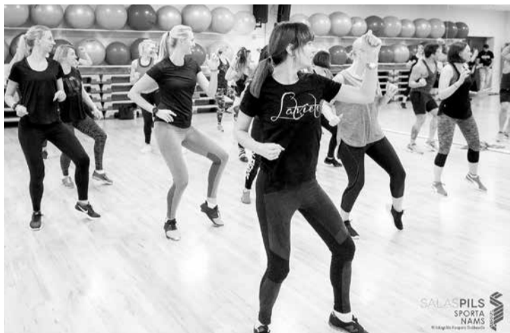
Sporta namā ir pieejama ne tikai aerobika, bet arī karstas dejas latīņu ritmos.

Pasākumu organizēja Salaspils sporta nams sadarbībā ar lieliskajiem treneriem, kuri saka lielu, lielu paldies visiem dalībniekiem, kuri šo dienu padarīja īpašu. Uz tikšanos sporta namā!