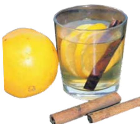
Dzēriens ar medu: ūdens, medus, citrona un apelsīna sula, kanēļa standziņas. Pagatavoja raksta autore.

Vasarā šos nosacījumus ievērot vieglāk, jo karstā laikā vairāk slāpst. Turpretī ziemā šī sajūta nav tik raksturīga un, šķiet, arī dzērienu izvēle ir krietni ierobežota. Aukstā, mitrā laikā par ūdeni un minerālūdeni pat domāt negribas. Kārojas pēc kaut kā karsta un uzmundrinoša, kas sasildītu.