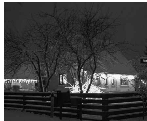
Gaišmiņu virtenes ieskauj visas ēkas un arī kokus.