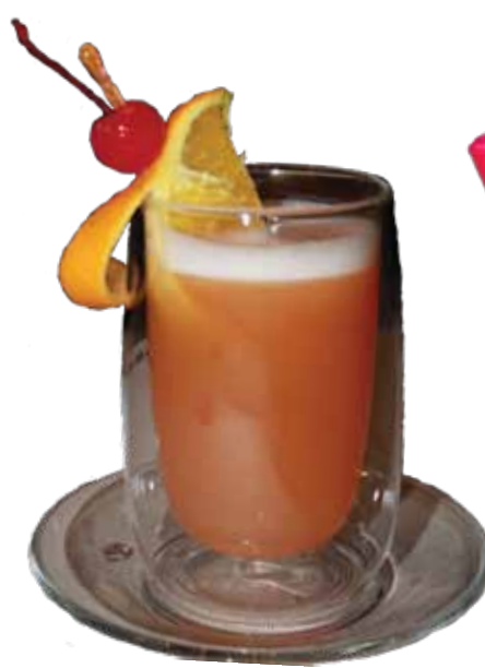
Karstā kolada: ananāsu un greipfrūtu sula, kokosriekstu sīrups. Pagatavoja Valdis Locs.