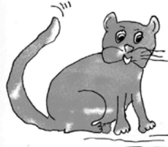
Kaķis grib atrast peli, bet nezina, pa kuru ceļu iet. Palīdzīto izdarīt!