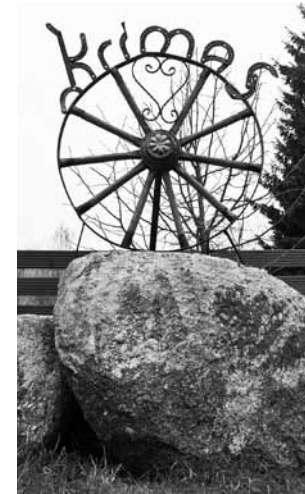
Uzraksts Krimas izgatavots pēc īpaša pasūtījuma.

„Labāk nenopirkt sev kādu dāvanu un naudu iztērēt tādām iepriecinājumam kā gaismas rotas.”