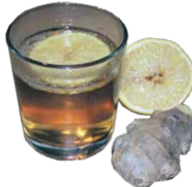
Karstais ābolu dzēriens: ābolu sula, rīvets ingvers, citroni. Pagatavoja raksta autore.