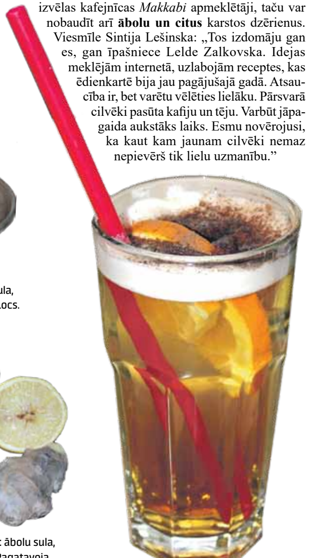
Ābolu dzēriens: ābolu sula, apelsīns, kanēlis. Pagatavoja Sintija Lešinska.