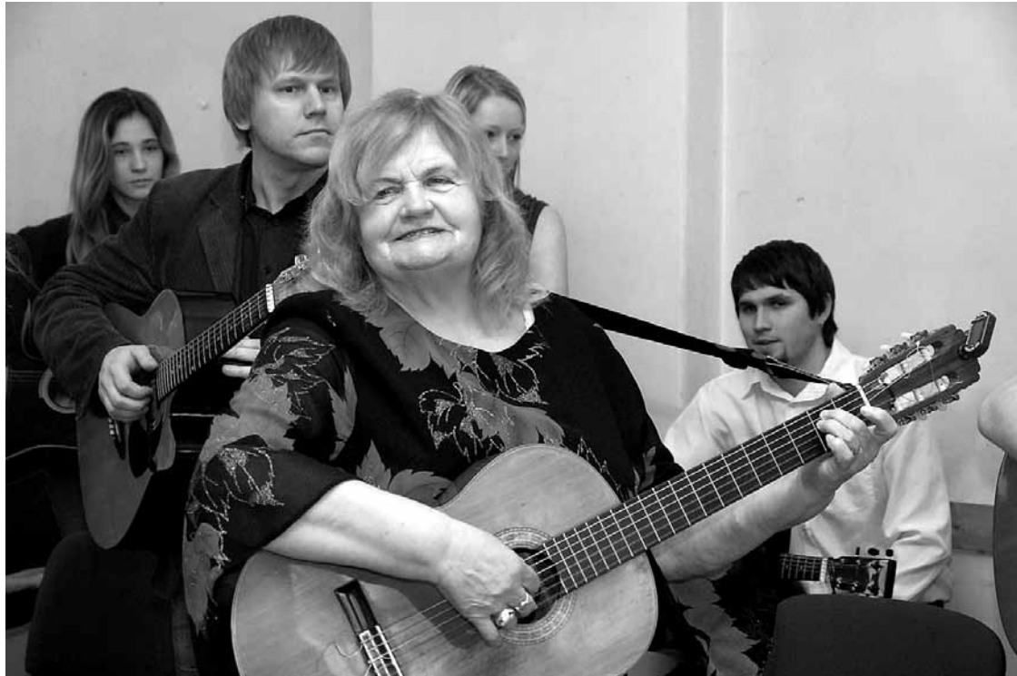
Daudzu milētā dziesminiece Austra Pumpure savā 80. jubilejas koncertā Kuldīgā 2012. gadā.

3. janvārī 88 gadu vecumā pa mūžības taku aizgājusi liepājniece Austra Pumpure – Latvijas dziesminieku kustības pamatlicēja, izcila Imanta Kalniņa un tautas dziesmu izpildītāja, kura prata aizskart daudzu dvēseles stīgas.