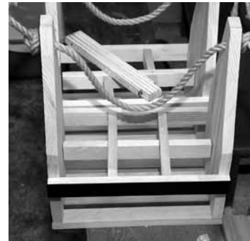
Aiz gara laika... Kaspars izveidojis pudeļu un burciņu kastes: vienā galā ir tāfele, uz kuras var uzrakstīt to, kas glabājas traukos, vai arī kādu novēlējumu.