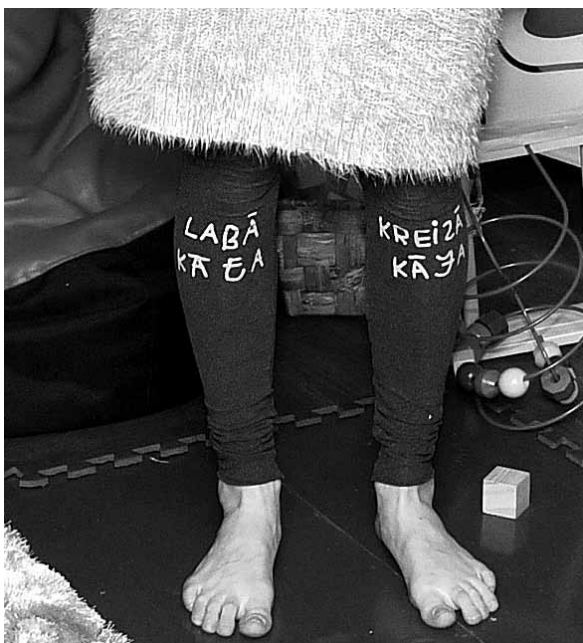
Lai nesajuktu! Aivara Vētrāja teksts un foto