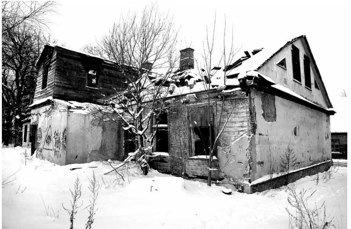
Vulkāna kluba ēka no pagalma puses.

Bijušās fabrikas Vulkāns administrācijas ēka. Īpašnieks nav arī izpildījis pašvaldības rīkojumu nosēgt dzīvībai bīstamās un bez vāka palikušās akas.