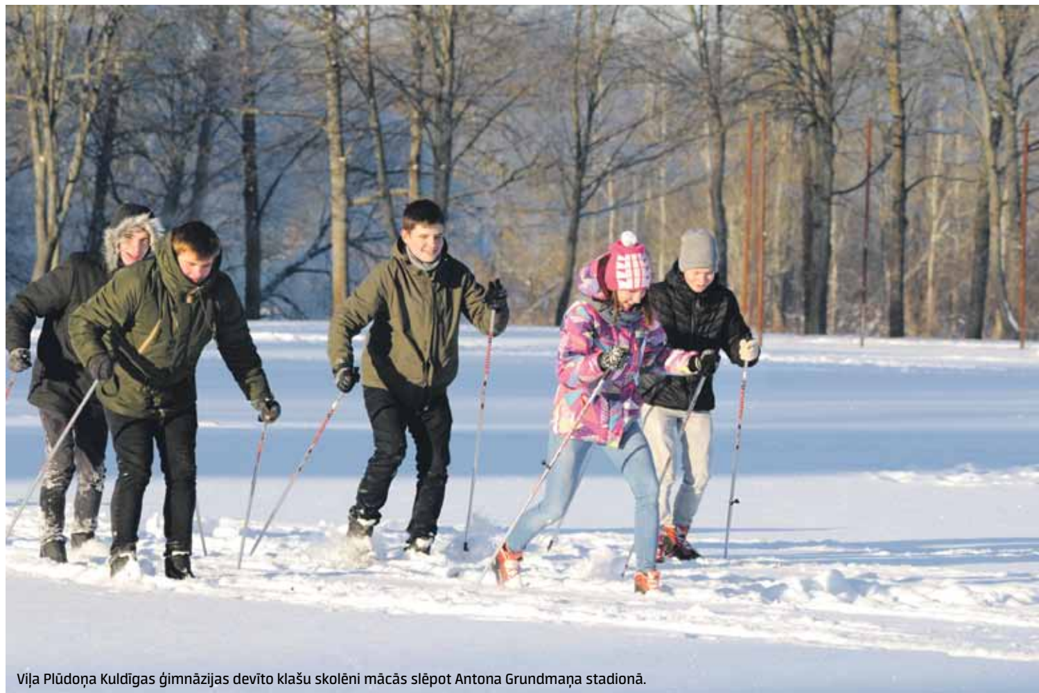
Viļa Plūdoņa Kuldīgas ģimnāzijas devīto klašu skolēni mācās slēpot Antona Grundmaņa stadionā.