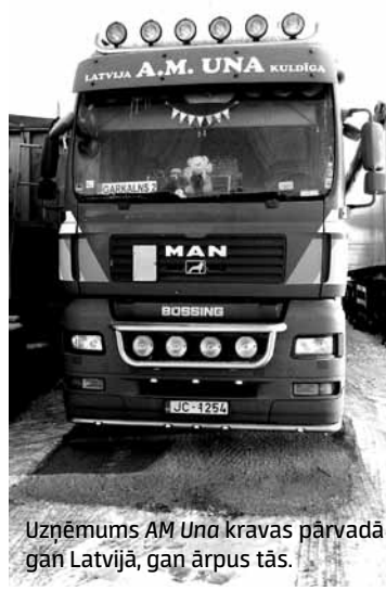
Uzņēmums AM Una kravas pārvadā gan Latvijā, gan ārpus tās.