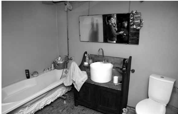
Gandrīz simt gadu vecās Zviedru mājas vannas istaba.