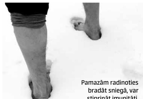
Pamazām radinoties bradāt sniegā, var stiprināt imunitāti.

Daudzi cilvēki, kas saslimuši, apņemas turpmāk stiprināt organisma imunitāti. Viena no daudzajām metodēm – basām kājām bradāt pa sniegu.