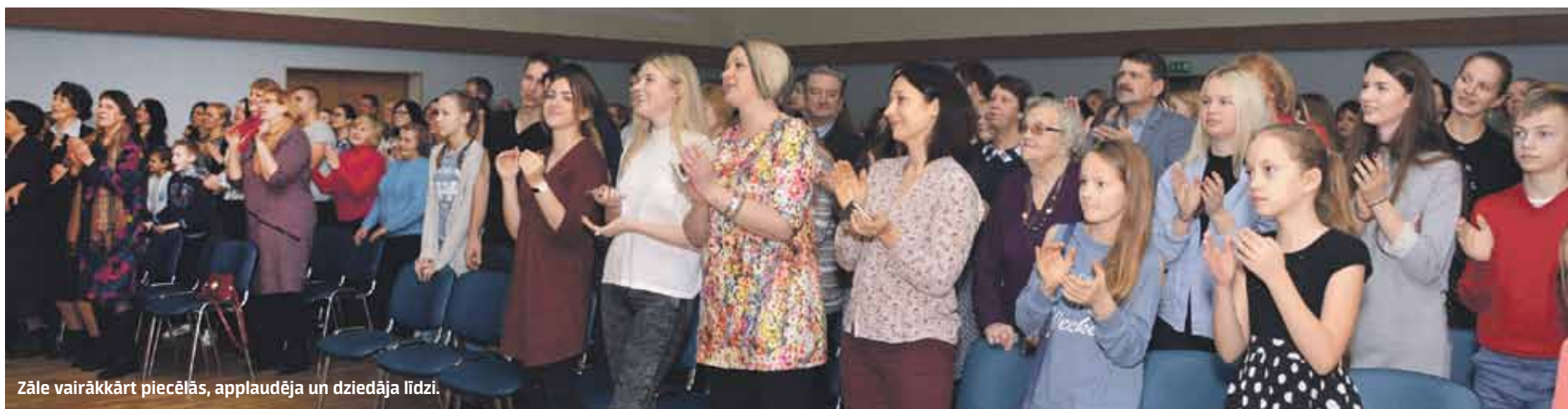
Zāle vairākkārt piecēlās, applaudēja un dziedāja līdzī.