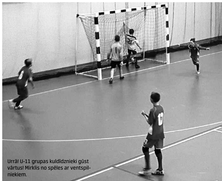
Urrā! U-11 grupas kuldīdznieki gūst vārtus! Mirkļis no spēles ar ventspilniekiem.