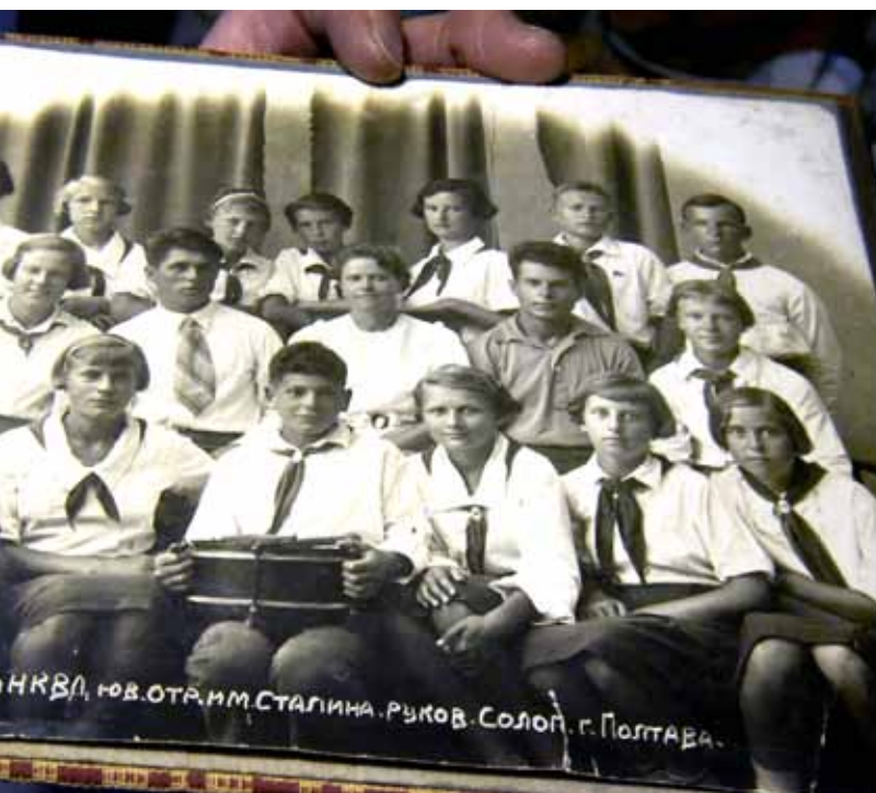
(eisās) Poltavas bērnumā – likteņa ironija, ka tas nosaukts NKVD (represiju iestādes) am Staļina vārds.