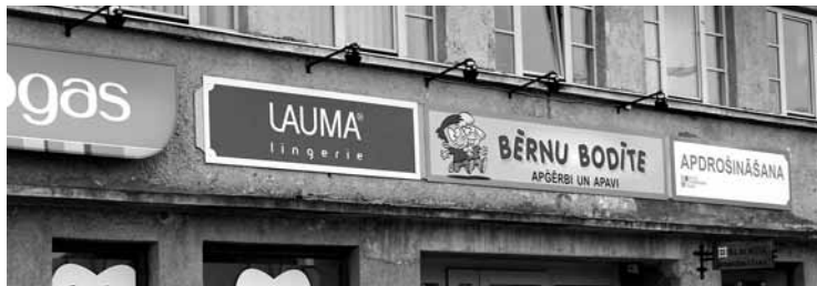
Kuldīgas veikals Bērnu bodīte Liepājas ielā iekārtots agrākā ziedu salona vietā.

Veikals Bērnu bodīte Kuldīgā, Liepājas ielā (ēkā, kurā ir Drogas ), kopš atvēršanas janvāra vidū jau paspējis gūt pircēju atsaucību.