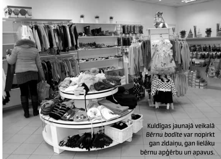
Kuldīgas jaunajā veikalā Bērnu bodīte var nopirkt gan zīdaiņu, gan lielāku bērnu apģērbu un apavus.