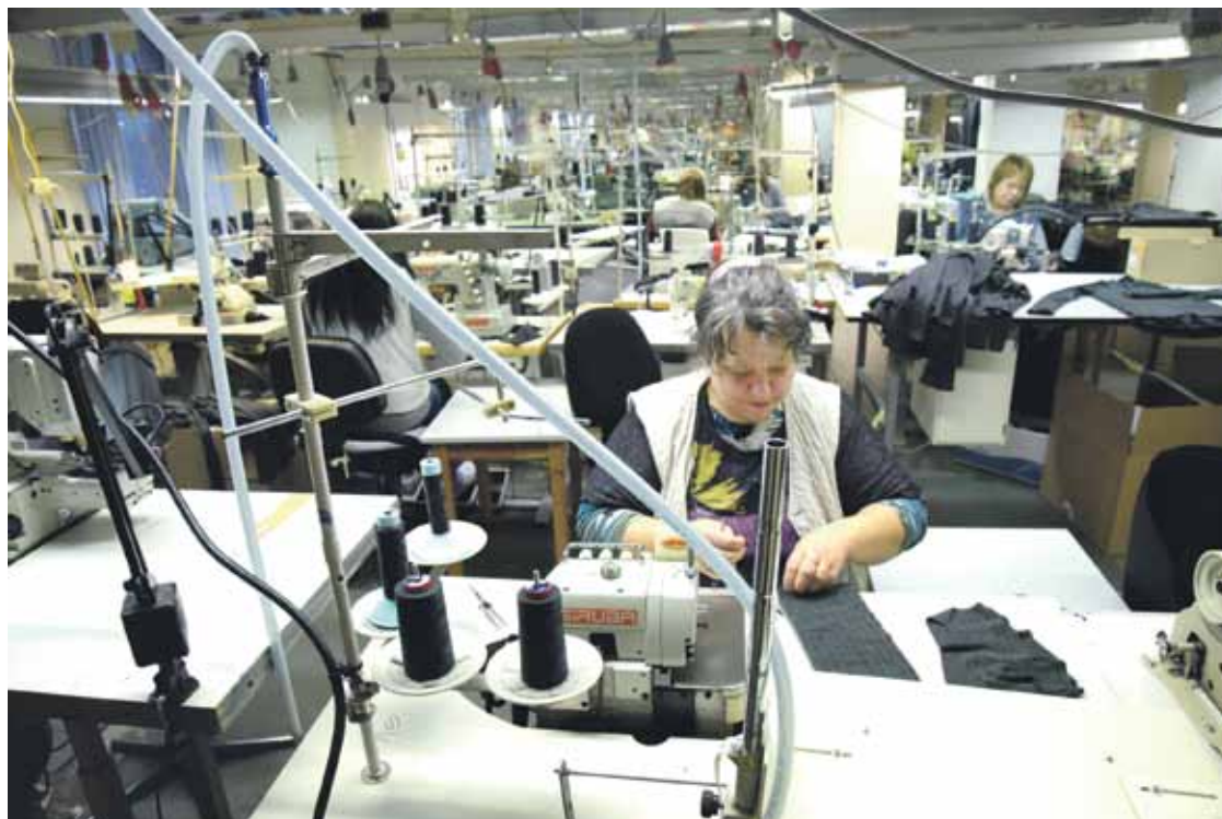
Uzņēmumā Kuldīgā ir ap 90 darbinieku, un te saražotie apģērbi 100% tiek eksportēti uz Zviedriju.

Ražotne darbojas Dzirnavu ielā, ko kuldīdznieki pēc sena ieraduma vēl sauc par trikotāžas rūpnīcu Māra . Vēl senāk ēkā atradusies Vintelera tūka fabrika.