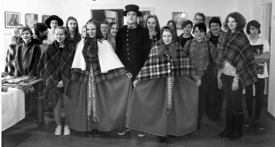
Konkursa Suiti turās! dalībnieki Alsungas muzejā varēja pielaikt tautastērpu.

Kuldīgas Mākslas un humanitāro zinību vidusskolas (KMHVZ) komanda uzvarējusi spēlē Suiti turās! , kas 31. janvārī notika Alsungā.