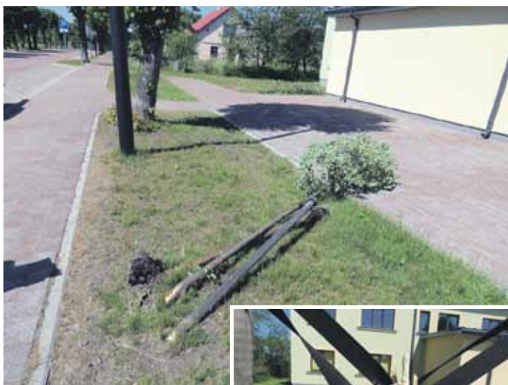
Attēlā redzamas pērn Kuldīgā, Stendes ielā, nolauztās Holandes liepiņas. Iespējamo vainīgo palīdzēja noskaidrot ekspertīze.

Pērnvasar Kuldīgā, Stendes ielā, tika nolauztas četras iepriekšējā gadā iestādītas Holandes liepiņas, nodarot 520 eiro zaudējumus. Kriminālprocesā ekspertīzes palīdzēja noskaidrot iespējamo vainīgo. Aizdomās turētais ir 1996. gadā dzimis vī-