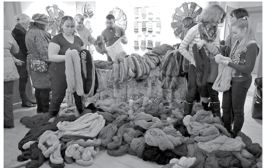
Kuldīgas vecajā rātsnamā Pāces vilnas fabrikas dzijai bija varena piekrišana – audējas stiepa prom māsītiem vien.

„Ja aitkopju attieksme mainītos un vilna būtu tīrāka, mēs būtu gatavi par to maksāt arī vairāk.”