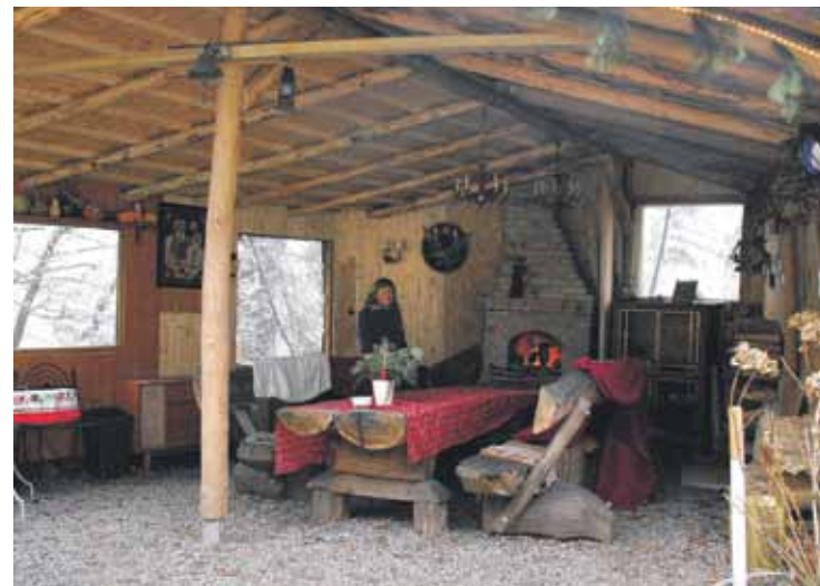
Lāse Juska Bērzaines āra kamīna nojumi izrotā ar egļu zariem. Latviešu īpašums Freiburgā aptver vairāk nekā 5 ha un ir skaista vieta svētkiem, labai atpūtai draugu vai kolēģu lokā.

Soferītis ir jautrs un runīgs, pametis aci spogulī, noprasa: „Atbraucāt pensiju notērēt, jā?” Piekrītam. „No kurienes?” No Latvijas! Tas puisim liekas pavisam eksotiski, un mums nākas izstāstīt, ka latviešiem ir sava valoda, nevis krievu, ka