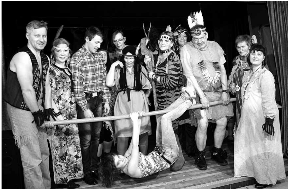
Rudbāržu karnevālā Brocēnu amatierteātris Mēs ataino medību tēmu.

Rudbāržu kultūras namā aizvadīts ceturtais amatierteātru karnevāls, kurā vietējie Spēlmaņi uzņēma draugus no tuvākiem un tālākiem novadiem.