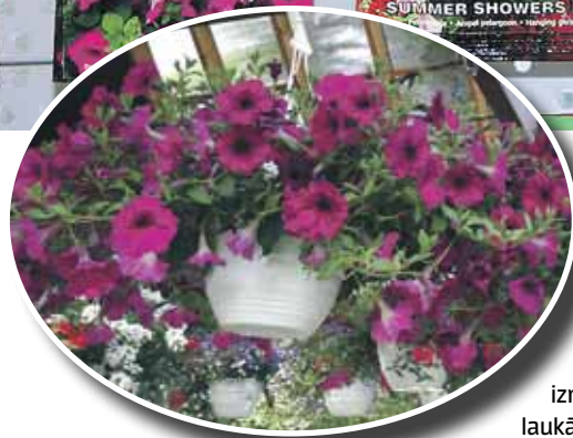
Kad petūnijas iznestas laukā, svarīgi tās nelikt vējainā vietā.