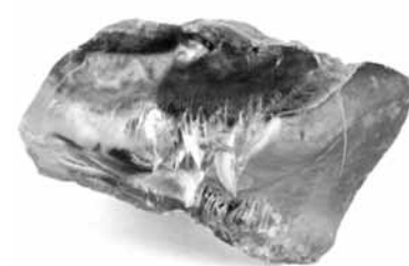
Dzintara smiltis, putekļus un pulveri var iegādāties īpašos veikalos Lietuvā, arī Rīgā, meklēt internetā, var sazināties ar pirtniekiem.