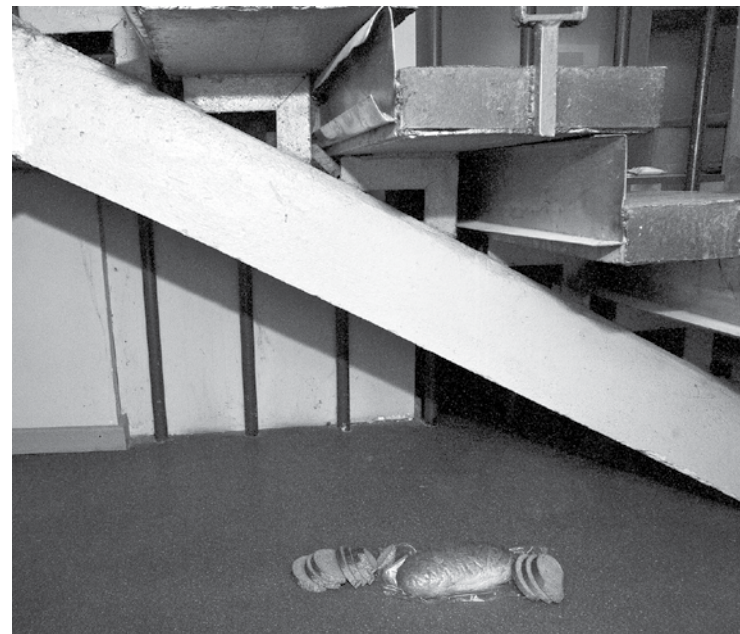
Pirms daudziem gadiem sieviete ar vīru laimīgi dzīvojusi kādreizējā viesnīcā Kursa , atmiņas sauc viņu tur atpakaļ.

Arī mūzikas skolas vadība vērsusies tiesībsargājošās iestādēs. Tā kā pēdējā laikā situācija kļuva arvien draudīgāka, janvāra beigās audzēkņu vecāki sāka vākt parakstus, lai likumsargi beidzot novērstu draudus bērniem. Tagad, iesaistoties Kuldīgas novada pašvaldībā, sieviete nogādāta Liepājas psihoneiroloģiskajā slimnīcā. Pēc atgriešanās skolai tikšot nodrošināta apsardze, bet skolotāji cer, ka tam nebūs vajadzības.