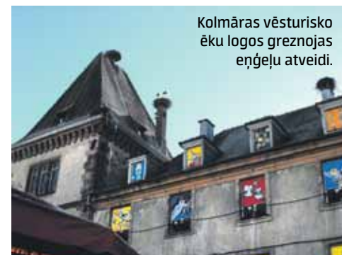
Kolmāras vēsturisko ēku logos greznojas eņģeļu atveidi.