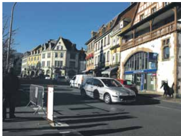
Saulaina decembra nogales diena Francijā, Kolmārā, kas atrodas vien 50 km no latviešu mītnes Bērzaine Vācijas pilsētā Freiburgā. Gleznaina pilsētiņa ar tiltiņiem un kanālu, pa kuru var vizināties.

izsalkušas, nogurušas, ceļu uz Bērzaini nezinošas. Izlēmām braukt ar taksometru. Kamēr somā meklējam lapiņu ar adresi, taksometra bagāžnieks jau atvērts, smaidīgs turku puisis jautā: „Kurp kundzes brauks?” Adresi pastudējis, viņš apņēmīgi satver stūri: „Es zinu, kur tas ir! Cēringena.” Tā, izrādās, sauc rajonu, kurā atrodas Bērzaine .