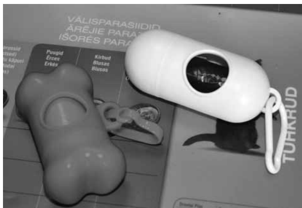
Dzīvnieku ekstrementu savākšanai arī Kuldīgas zooveikalos var nopirkt vai kā dāvanu saņemt maisiņus īpašā somiņā (to var piestiprināt pie pavadas).