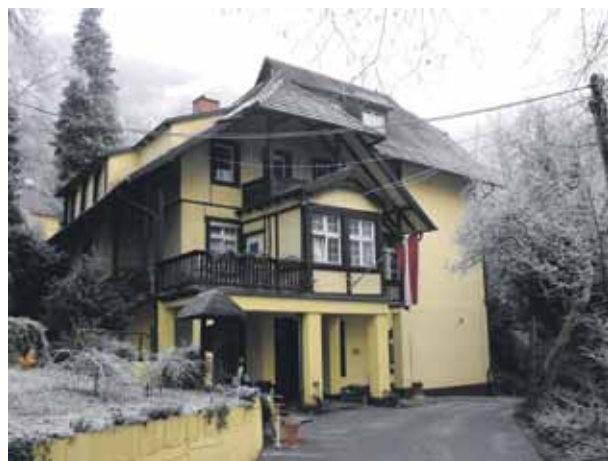
Daugavas vanagu īpašums Bērzaine Freiburgā, Cēringenas pilsdrupu pakājē, tagad pārtapis latviešu kultūras centrā.

Ziemas diena ir īsa. Gandrīz pēc 12 stundu ceļa galapunktā ieradāmies pavisam tumsā –