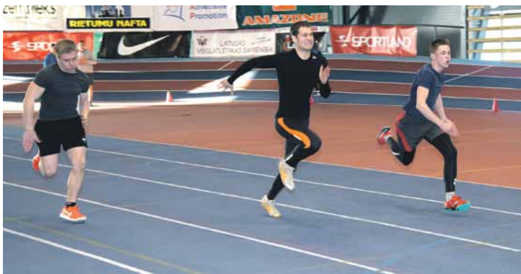
Spraigas cīņas 60 m distancē vīriešiem.