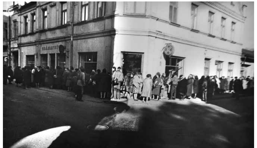
Rinda pēc Margaretas Mičelas grāmatas Vējiem līdzī pie Kuldīgas lielās grāmatnīcas pagājušā gadsimta 80. gados.

Kā liecina Baltic International Bank Latvijas barometra pētījums, 43% Latvijas iedzīvotāju atzīst, ka pēdējā pusgada laikā nav izlasījuši nevienu grāmatu. Par spīti uzskatam, ka biežākie grāmatu nelasītāji ir jaunieši, aptauja apliecina, ka realitātē visretāk grāmatu rokās ņem vidēja vecuma cilvēki (30–50 gadi). Savukārt lielākā daļa cilvēku pēc 55 gadu vecuma grāmatas lasa ik dienu, tam atvēlot vismaz pusstundu. Interesanti, ka grāmatu burvībai biežāk nododas sievietes – viņu vidū nelasa tikai 31%, kamēr starp vīriešiem šai nodarbei ikdienā laiku atrod 48% respondentu.