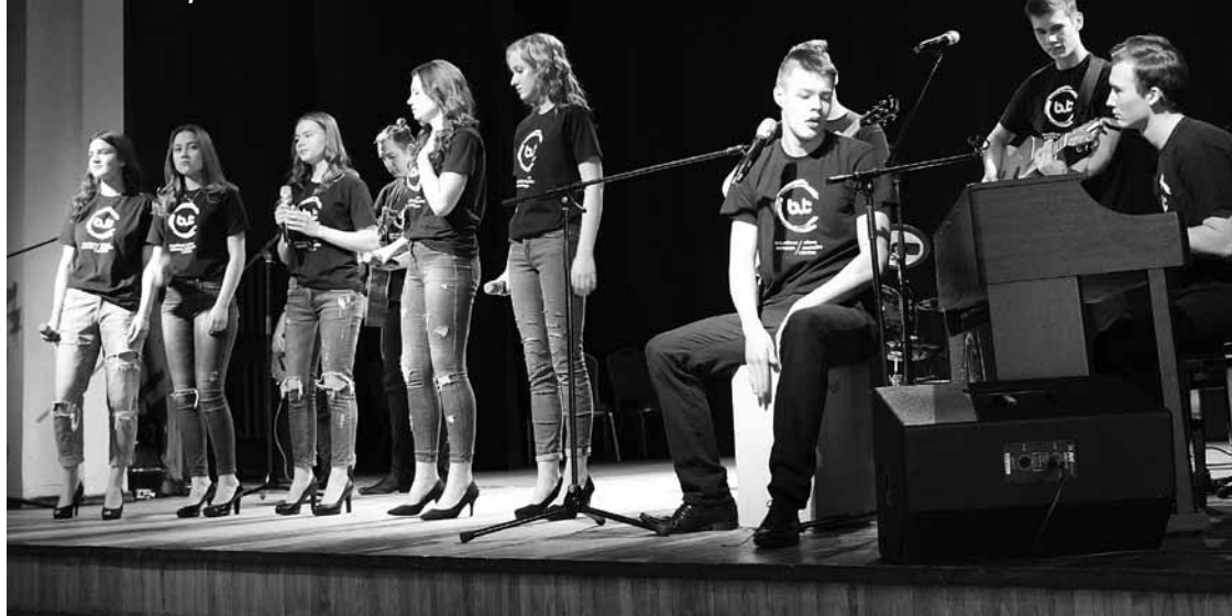
Kuldīgas novada skatē muzicē vokāli instrumentālais ansamblis Mona .

Ir zināmi Kuldīgas novada instrumentālo, vokāli instrumentālo ansambļu (VIA) un popgrupu konkursa No baroka līdz rokam , kā arī vokālo ansambļu konkursa Balsis rezultāti.