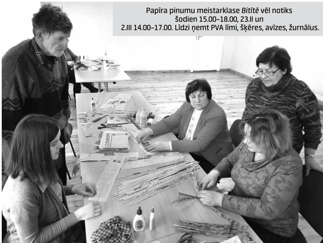
Papīra pinumu meistarklase Bitītē vēl notiks šodien 15.00–18.00, 23.II un 2.III 14.00–17.00. Līdzī ņemt PVA līmi, šķēres, avīzes, žurnālus.