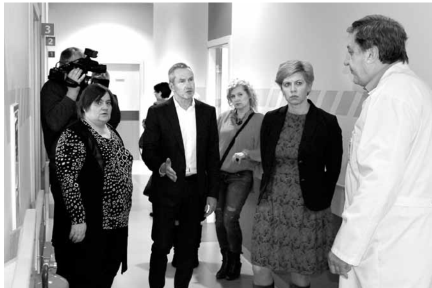
Veselības ministre Anda Čakša (otrā no labās) izstaigāja Kuldīgas slimnīcu. Atzinīgus vārdus ministre teica par rehabilitācijas nodaļu.

Veselības ministre A.Čakša apmeklēja arī Kuldīgas veselības centru, kur tikās ar ģimenes ārstiem: „Manuprāt, izveidojusies ļoti veiksmīga kopprakse, kas ir mūsu nākotnes modelis.” Vēlāk preses konferencē A.Čakša uzsvēra: „Mēs domājam par skaidru lomu sadalījumu pieejamības nodrošināšanā – par ko atbildīga pašvaldība, par ko – valsts. Kuldīga ir salīdzinoši labā situācijā – te ir pacientu skaitam atbilstošs prakšu skaits, bet apkārt ir